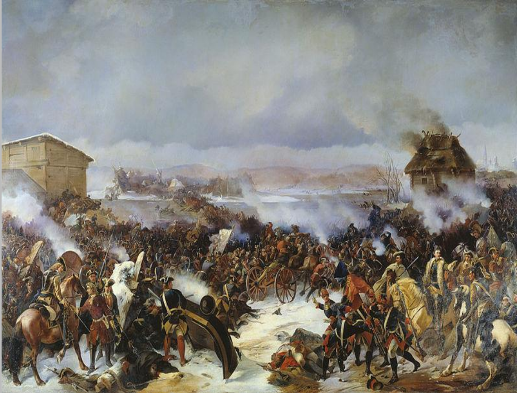
Битва при Нарве.