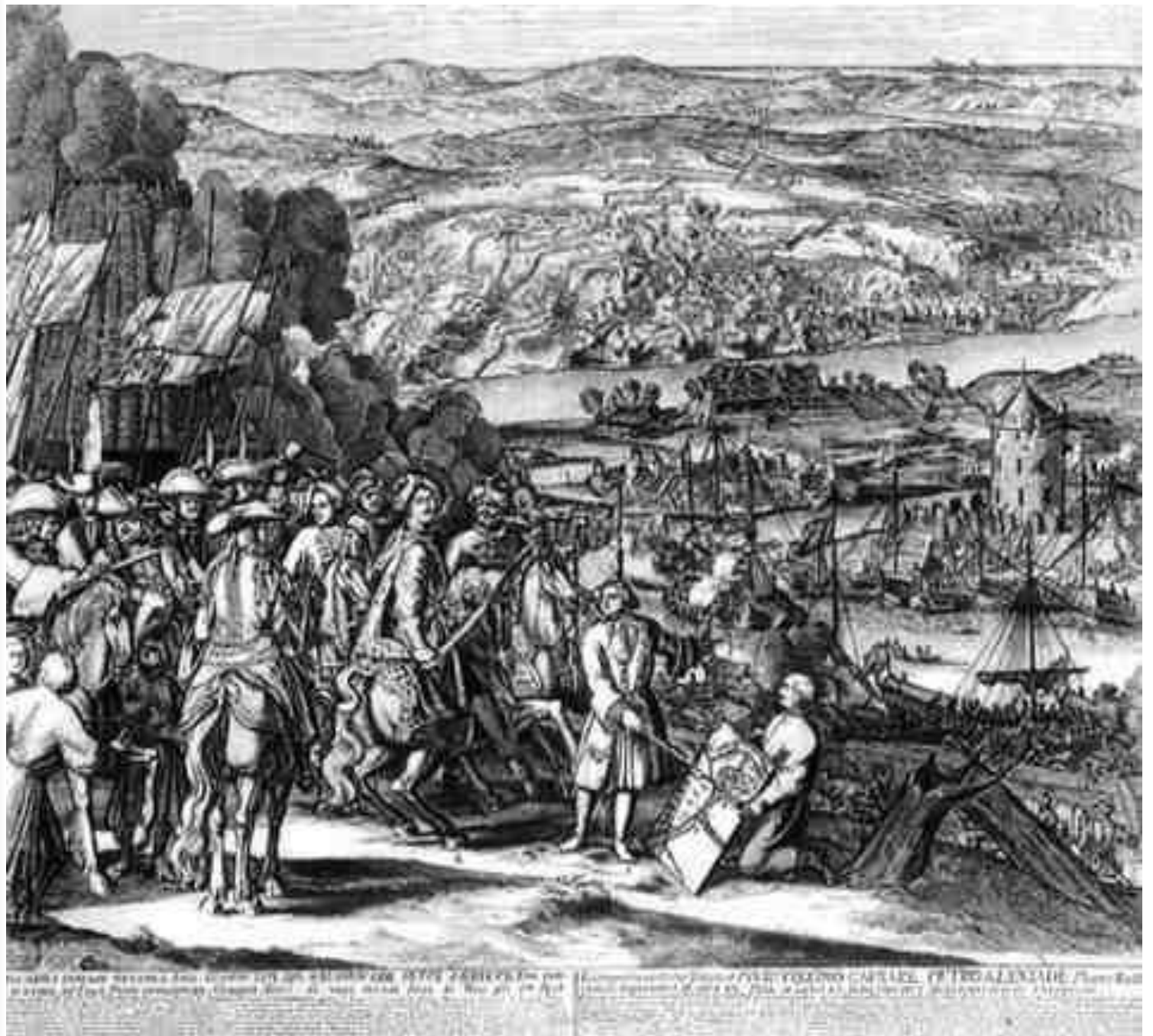
THE BATTLE OF TEWKESBURY, WHICH WAS FIGHTEN ON THE 28TH OF MAY 1471. THE KING OF FRANCE WAS AT THE BATTLE, AND WAS KILLED. THE ENGLISH WERE VICTORIOUS, AND THE FRENCH WERE DEFEATED. THE KING OF FRANCE WAS BURIED IN THE CHURCH OF ST. MARY AT TEWKESBURY.