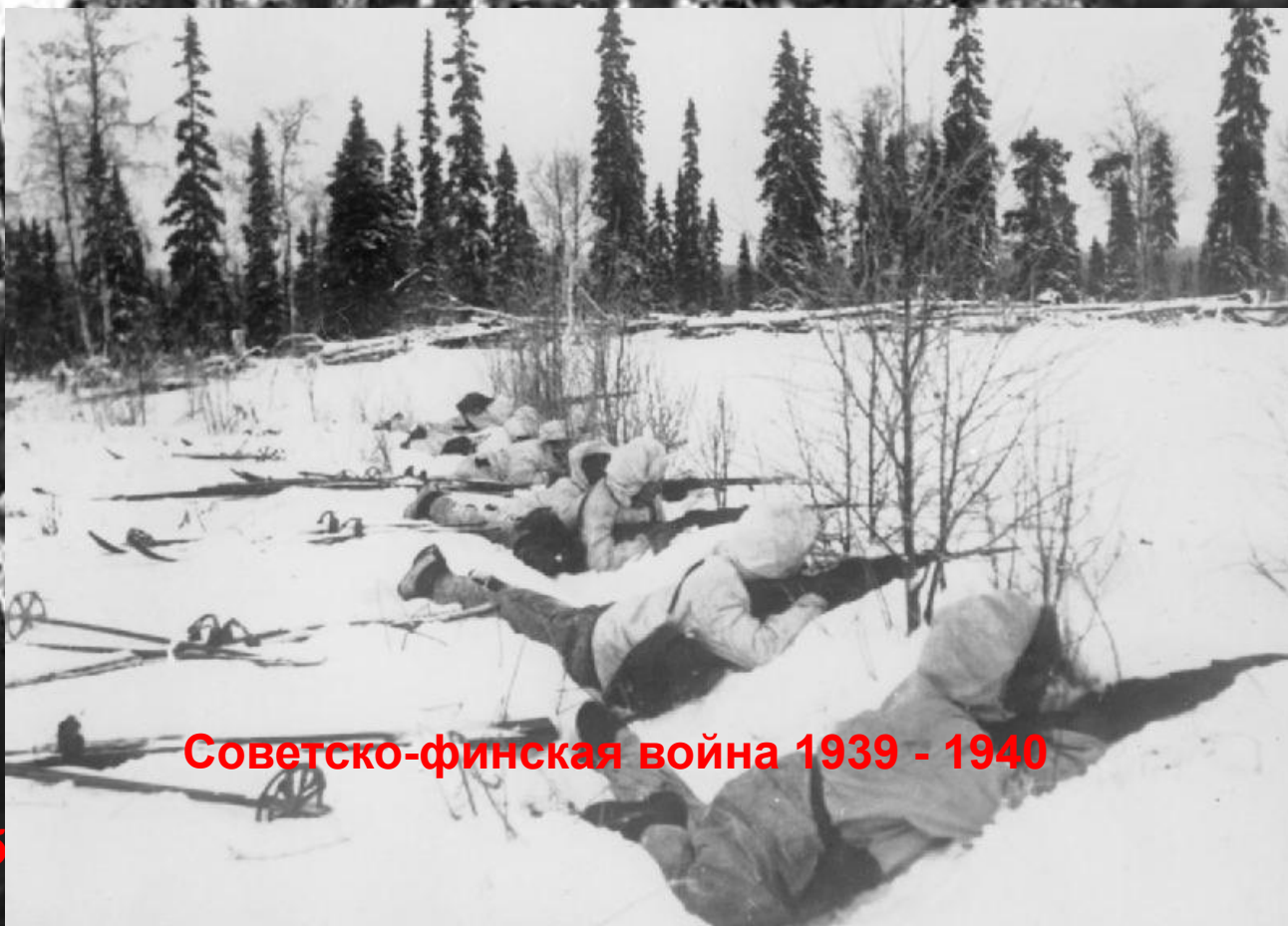
Советско-финская война 1939 - 1940