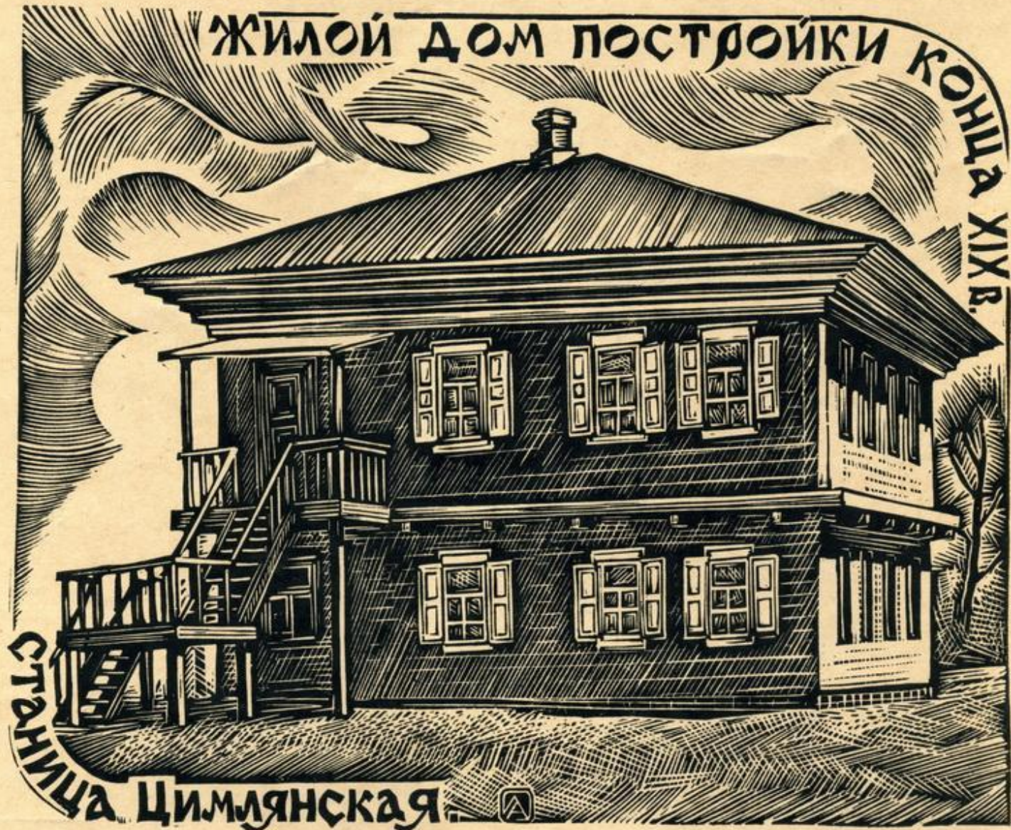
Козачий курень в ст. Цимлянской.