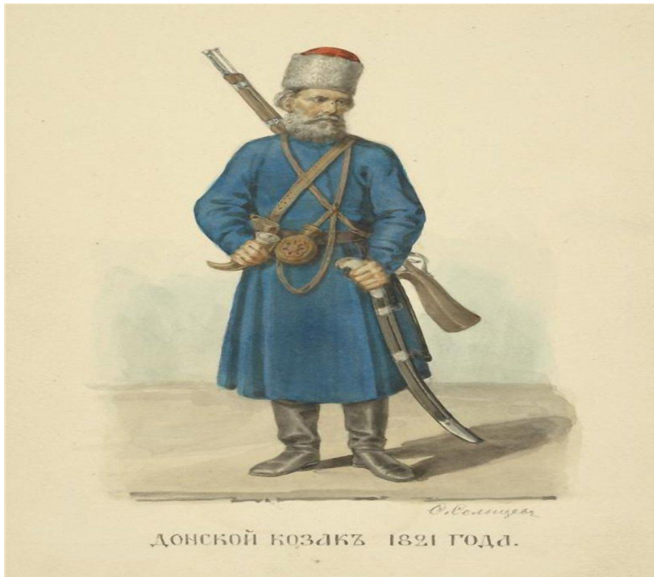
ДОНСКОЙ КОЗАКЪ 1821 ГОДА.