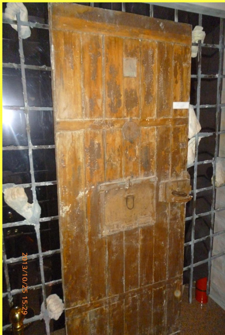
Дверь камеры, оригинал