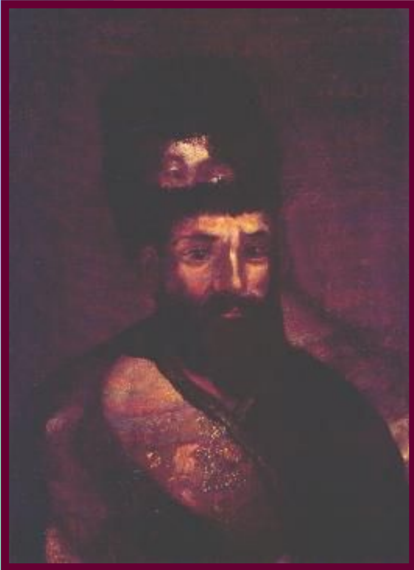
Портрет Пугачева на фоне Портрета Екатерины II.

Е.И.Пугачев родился на Дону.Во время Семилетней войны он дослужился до чина хорунжего. В 1771 г. дезертировал из армии и в 1773 г.появился на р.Яик и объявил себя «чудесно спасшимся» Петром III.