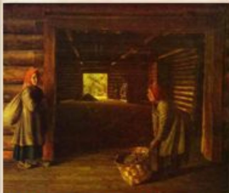
Художник Григорий Васильевич Сорока

Это было связано не с новыми формами труда, а с освоением новых земель, которые Россия завоевала в Северном Причерноморье