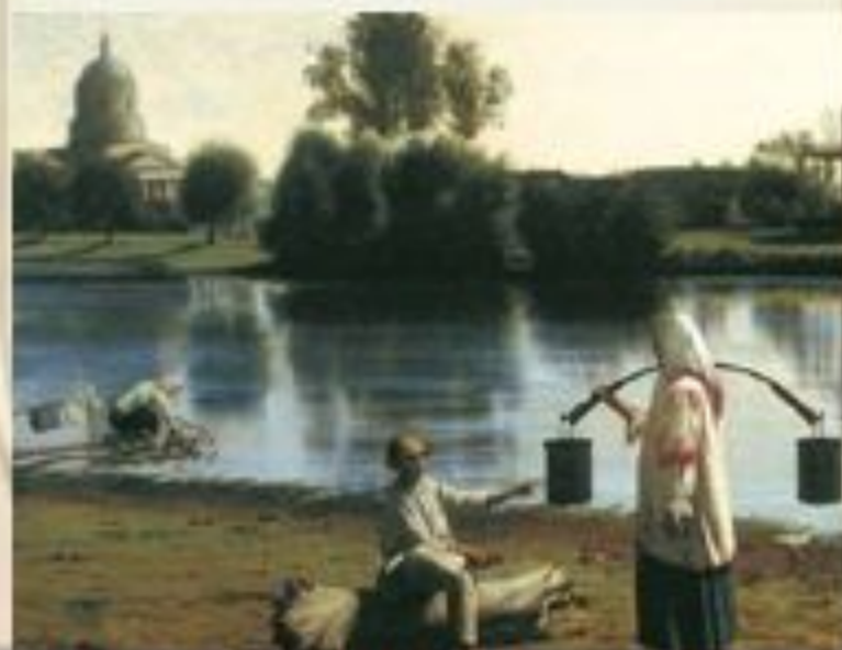
Художник Григорий Васильевич Сорока

Стремясь быстро освоить новые земли и заселить их, Екатерина II приказала выделять помещикам, согласным на переселение своих крепостных в южные районы, от 1,5 тысячи до 12 тысяч десятин