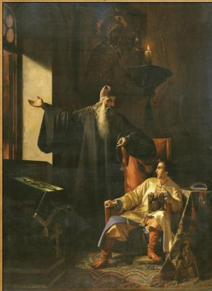
Иван IV и протопоп Сильвестр во время большого московского пожара 24 июня 1547 года (Павел Плешанов, 1856 год)

В том же, 1547 году, в Москве занялся сильнейший пожар. Свыше 1700 обгорелых трупов было найдено в городе (жителей было около 100 тыс.), и по Москве поползли слухи, будто город спалили колдовством, а виной всему — Глинские.