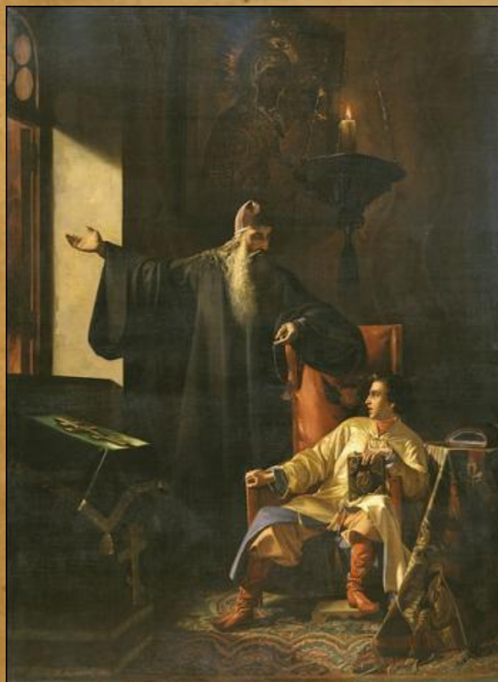
Иван IV и протопоп Сильвестр во время большого московского пожара 24 июня 1547 года (Павел Плешанов, 1856 год)

В том же, 1547 году, в Москве занялся сильнейший пожар. Свыше 1700 обгорелых трупов было найдено в городе (жителей было около 100 тыс.), и по Москве поползли слухи, будто город спалили колдовством, а виной всему — Глинские.