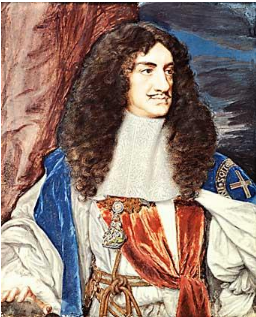
▶ Карл II