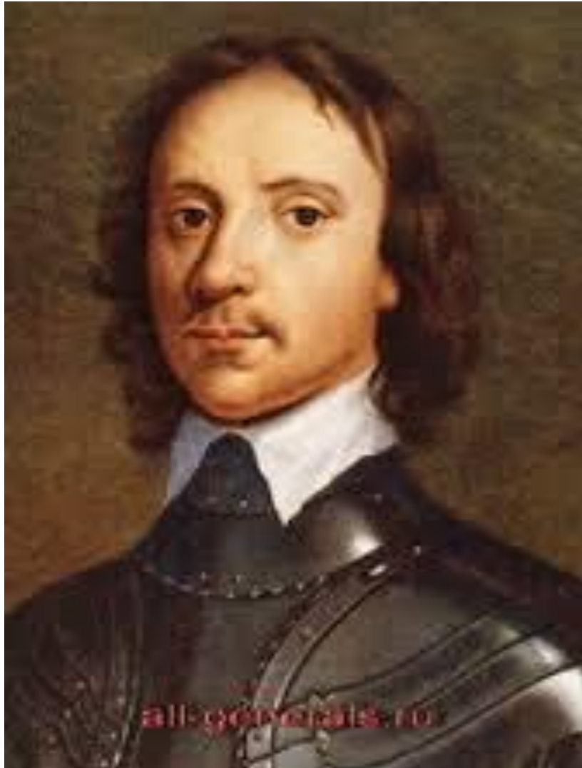
Оливер Кромвель (1599-1658)

Кромвель добился суда над королем, его казнили в начале 1649 г.