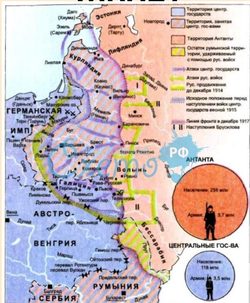
Восточный театр военных действий 1914—1917