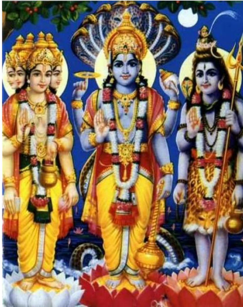
Брахма, Вишну, Шива