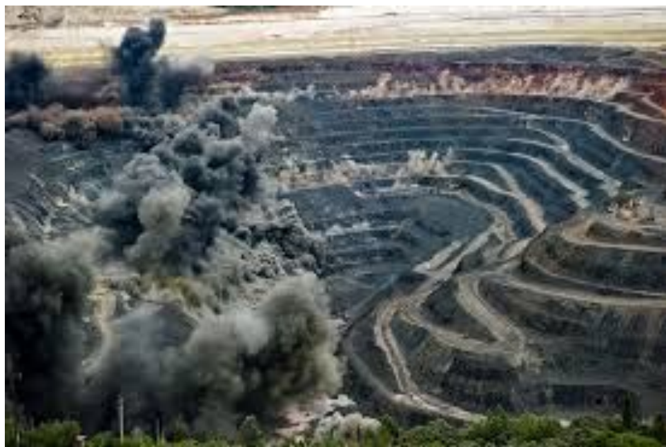
Железная руда Приилимье