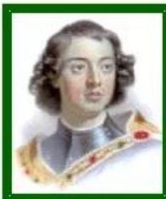
Петр I 1682-1725

Период в истории России с 1725 по 1762 г.