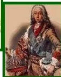
Петр III 1761-1762