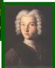
Петр II 1727-1730