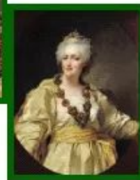
Екатерина II 1762-1796