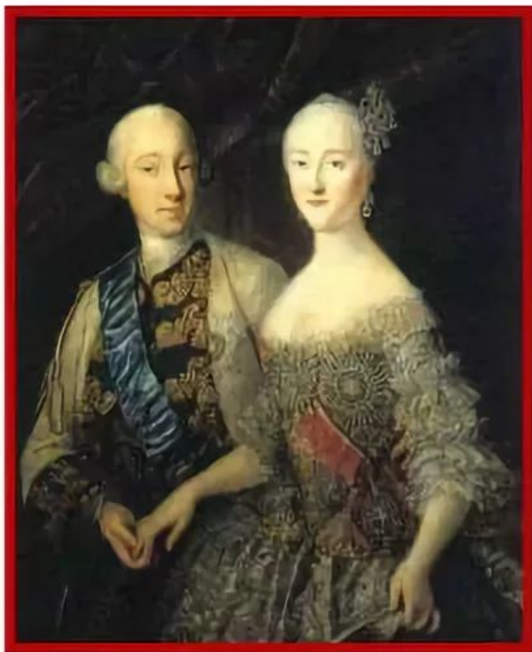
Петр Федорович, великий князь, Екатерина Алексеевна, великая княгиня.