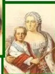
Иван VI Антонович и Анна Леопольдовна 1740-1741