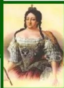
Анна Иоанновна 1730-1740