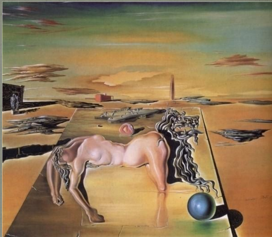
Сальвадор Дали. Незримые лев, конь и спящая женщина (1930)

Главные деятели движения — Андре Бретон , Луи Арагон , Сальвадор Дали