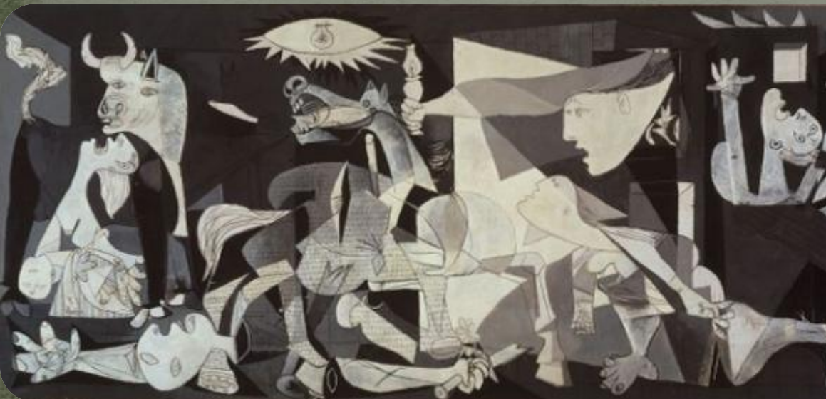
Пабло Пикассо «Герника»