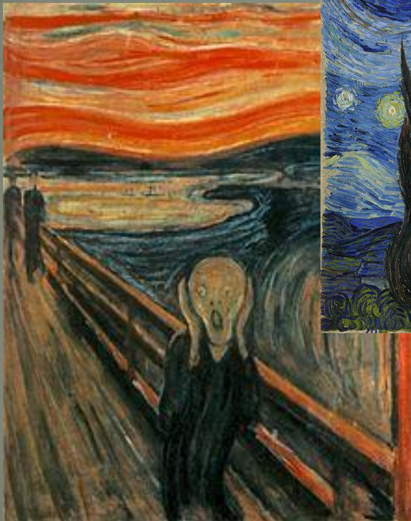
Эдвард Мунка «Крик»(1893)