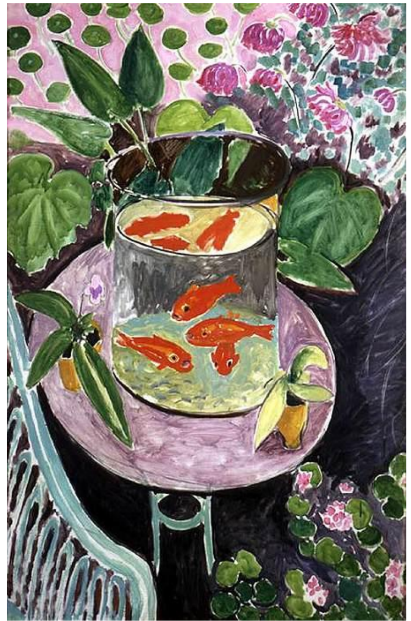
Анри Эмиль Бенуа Матисс Красные рыбы [1912]

Фовизм - локальное направление в живописи нач. XX в. Наименование Ф. было в насмешку присвоено группе молодых парижских художников ( А. Матисс , А. Дерен, М. Вламинк, А. Марке, Э.О. Фриез, Ж. Брак, А.Ш. Манген, К. ван Донген), Его участников объединяло в те годы стремление к созданию художественных образов исключительно с помощью предельно яркого открытого цвета.