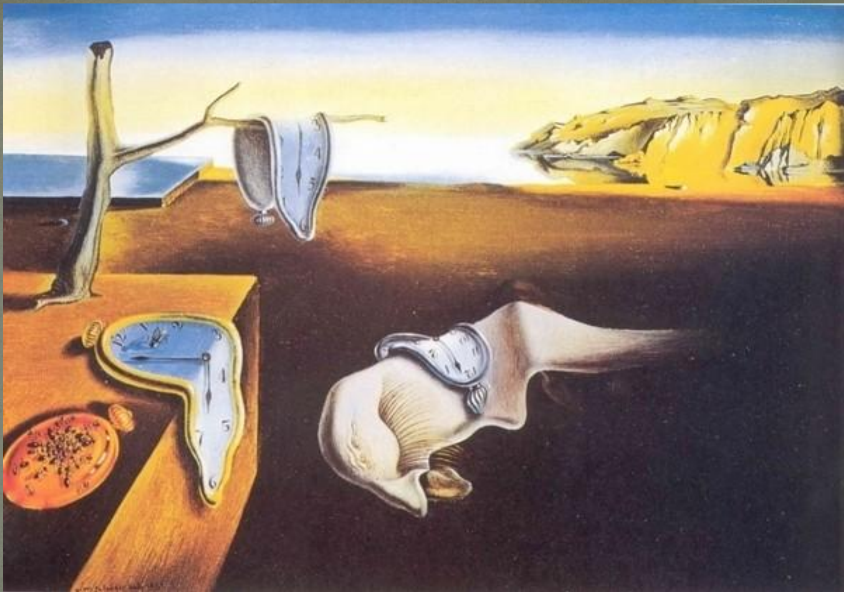
Постоянство памяти (1931) Сальвадор Дали