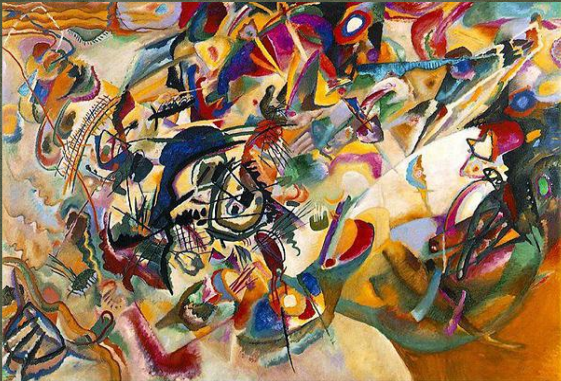
Василий Кандинский «Комозиция №7»