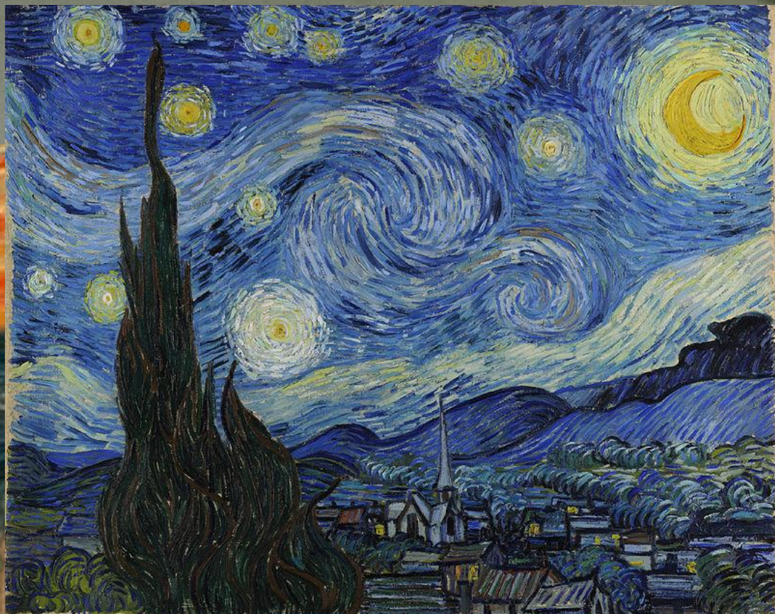
Винсент ван Гог «Звездная ночь»