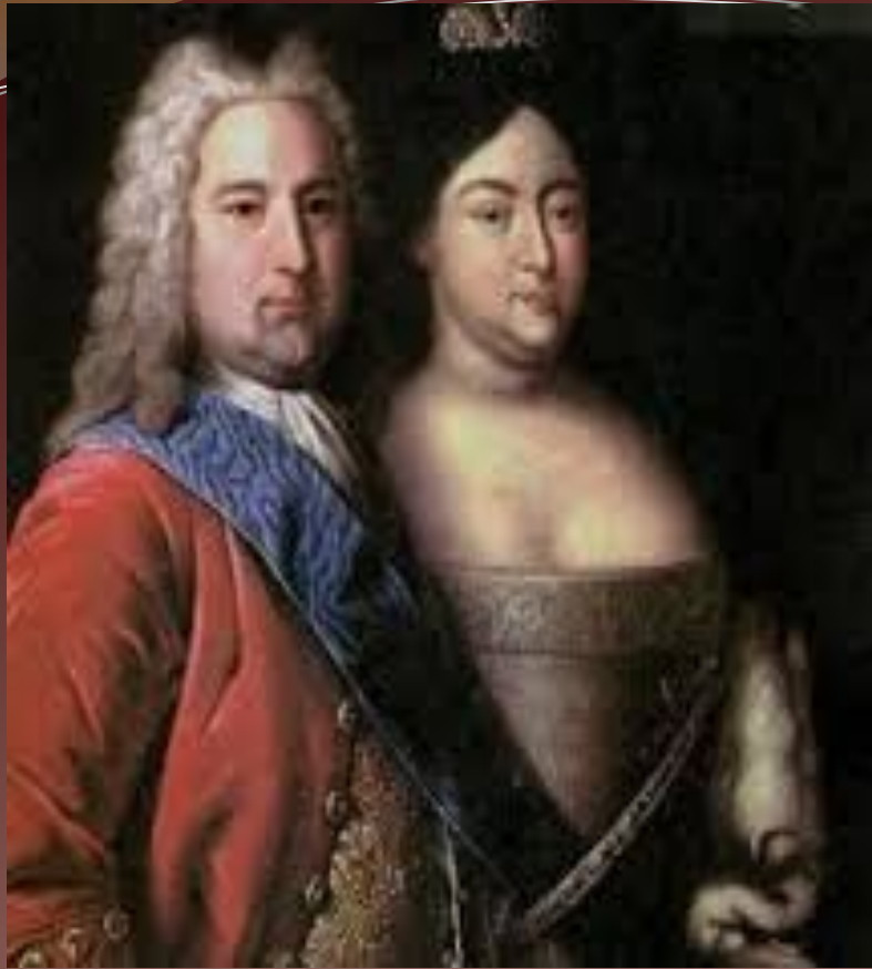
Анна Иоанновна и Эрнст Бирон

ФАВОРИТ- приближенное, доверенное лицо государя, способное влиять на его решения