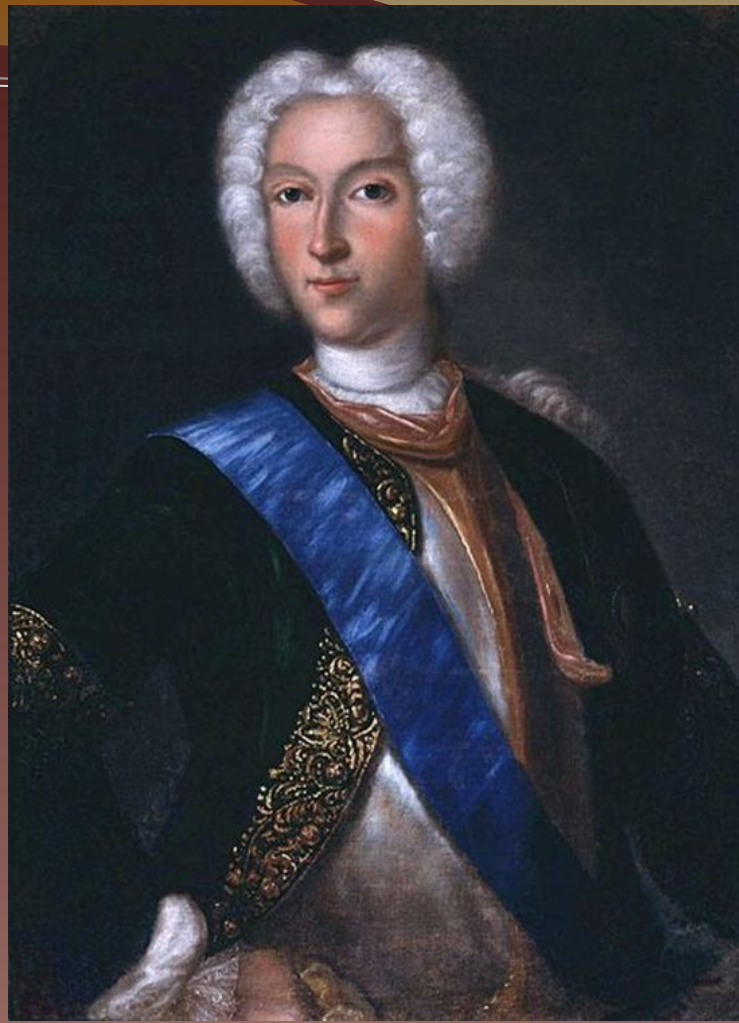
Пётр II Алексеевич