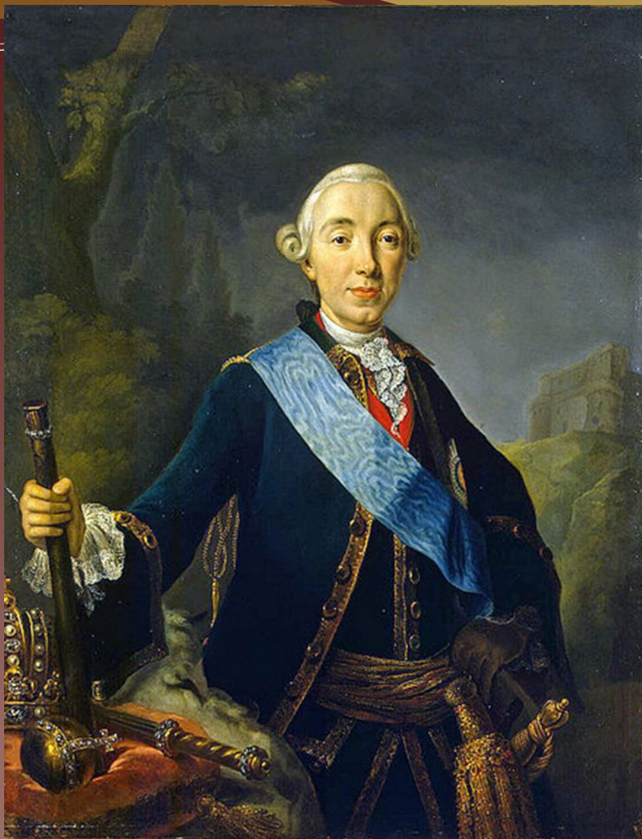
Пётр III Фёдорович