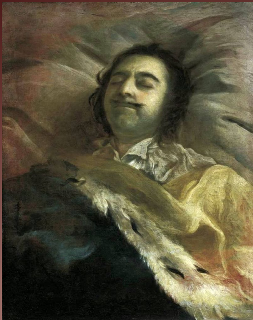
И.Н.Никитин. Петр I на смертном ложе