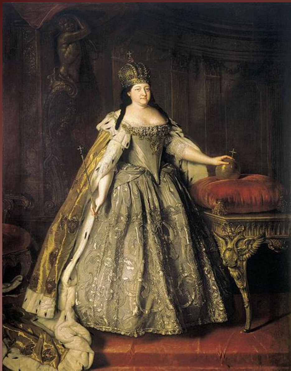
Анна Иоанновна 1730 - 1740