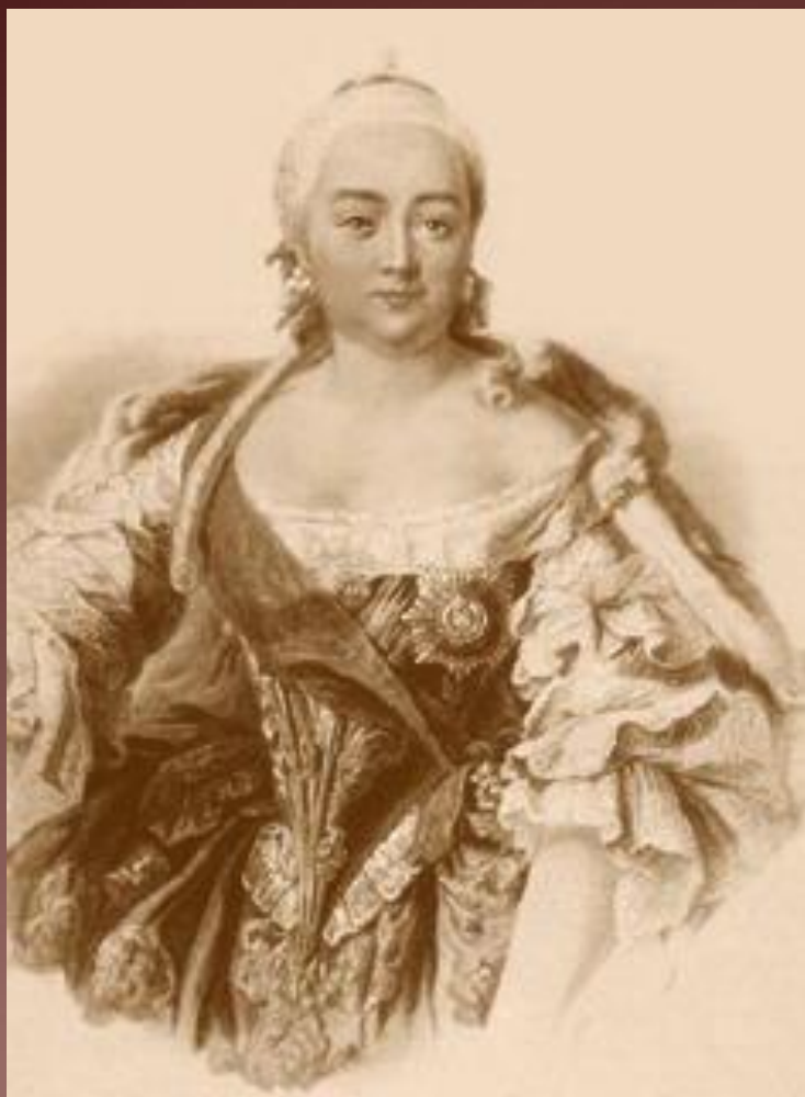
Елизавета Петровна 1741 - 1761