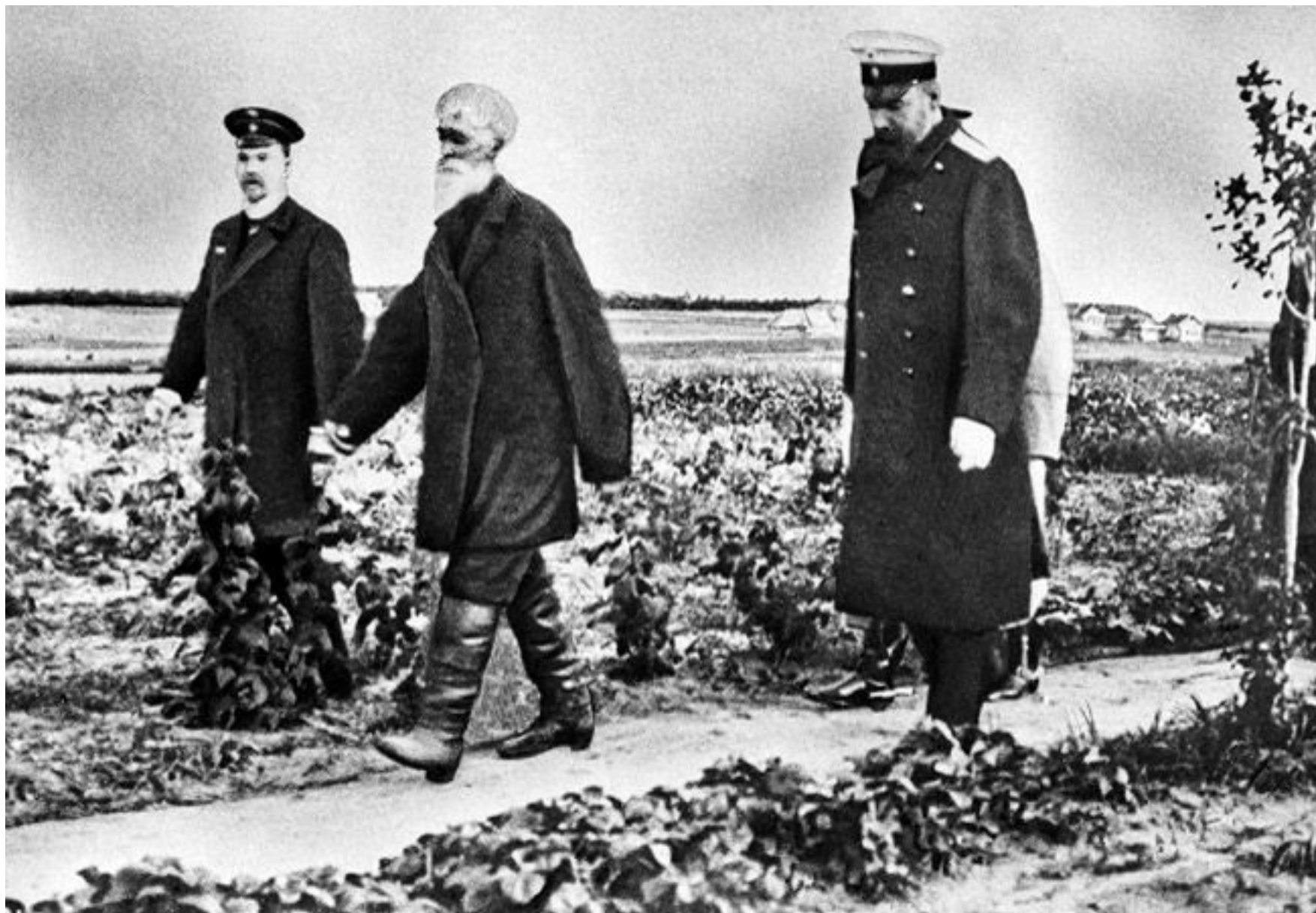
П.А. Столыпин во время знакомства с хуторским хозяйством