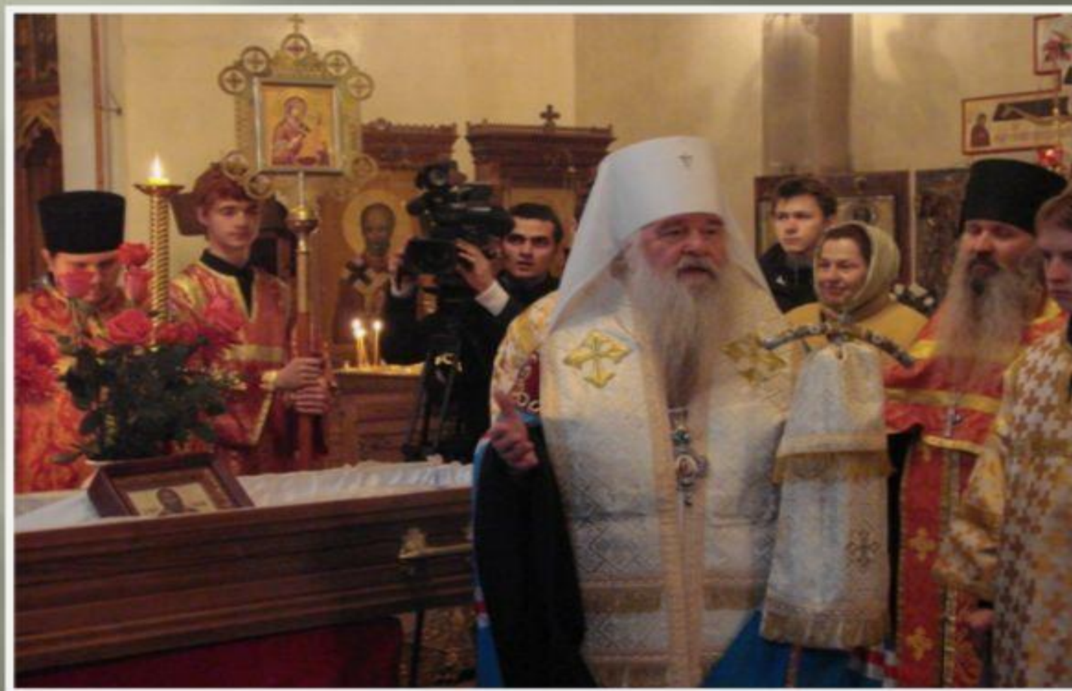
Поклонение обретенному святому