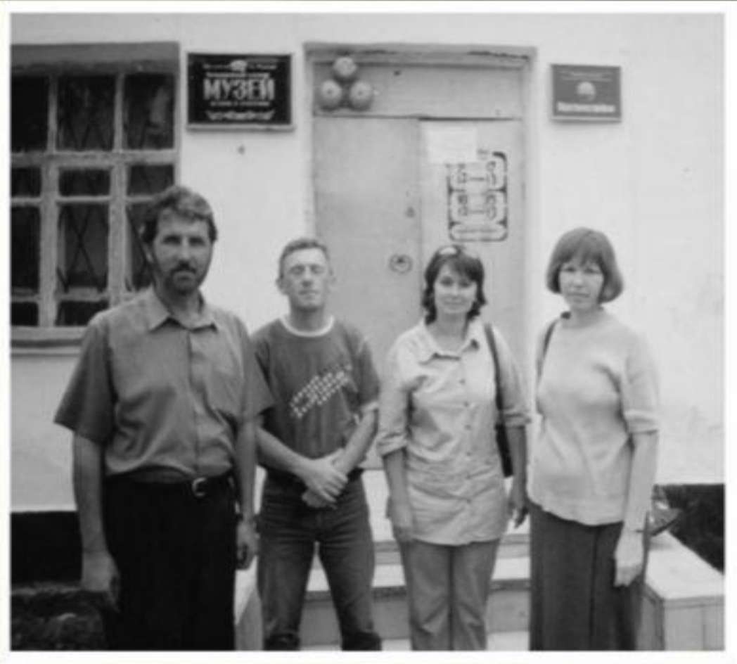
Работники районного краеведческого музея и делегация из Ростова.

Через 87 лет после убийства священника были проведены раскопки в хуторе и на месте, где в прошлом находилась хуторская церковь – удалось обнаружить останки погребения священнослужителя.