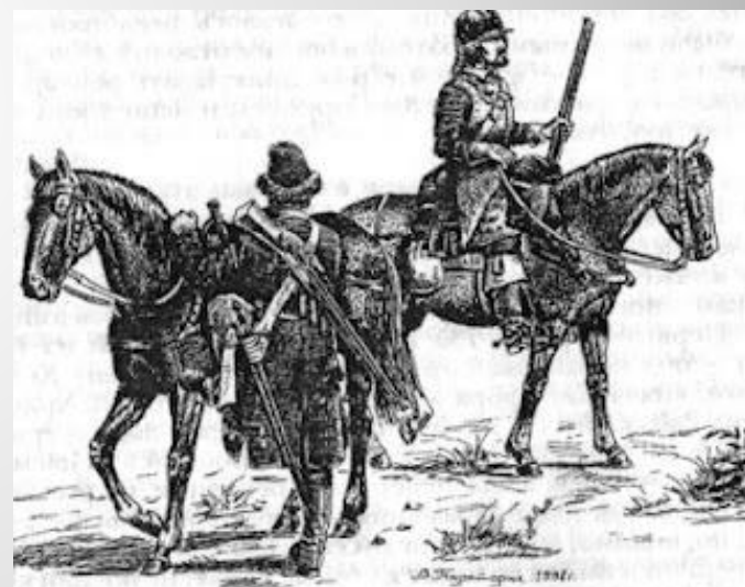
Рис. 76. Русские кавалеристы второй половины XVII в. Драгун (на переднем плане) и рейтар.