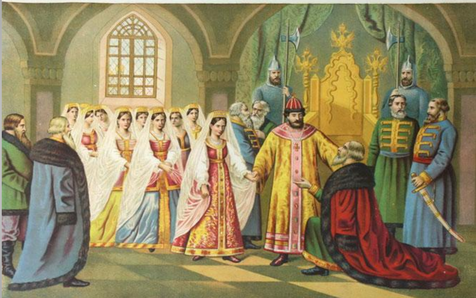
Выбор второй жены царя