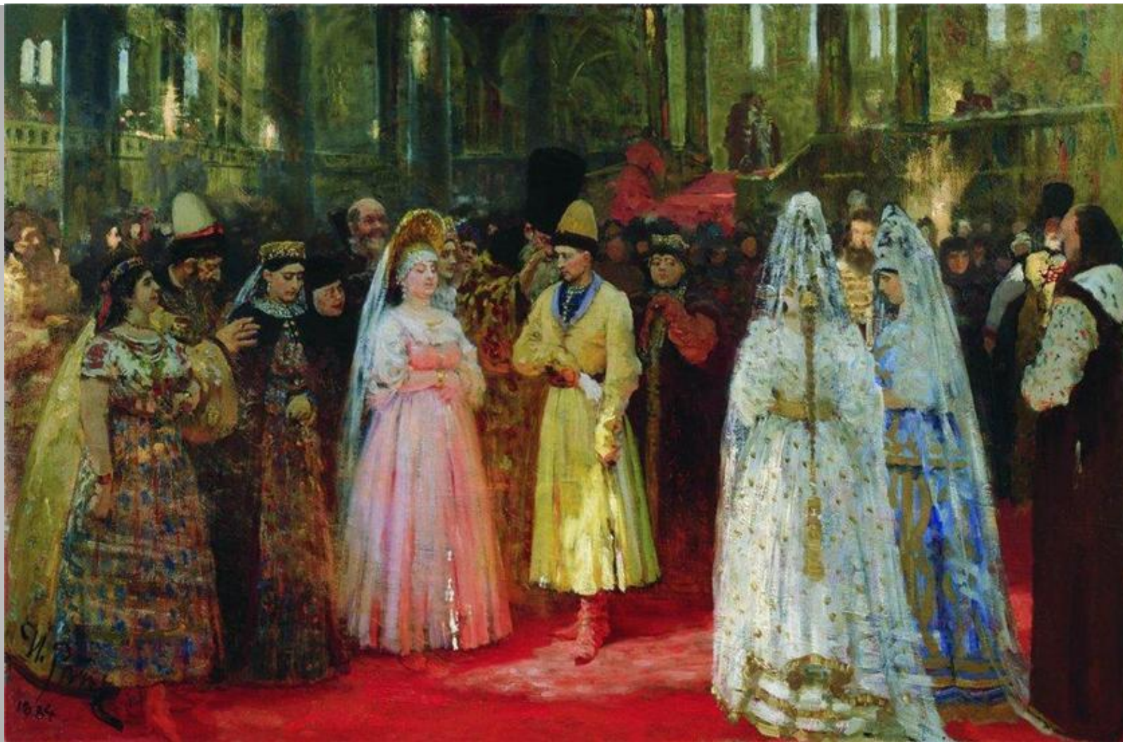
И.Репин. Выбор невесты царя Михаила Федоровича.