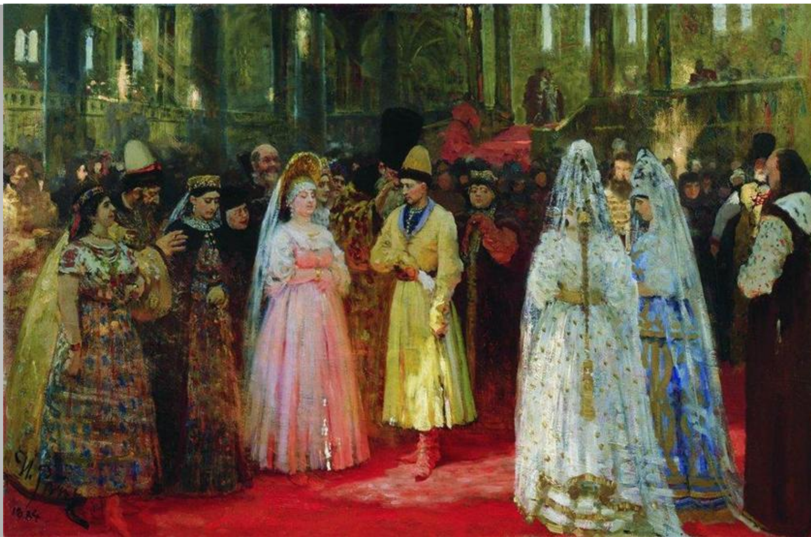
И.Репин. Выбор невесты царя Михаила Федоровича.