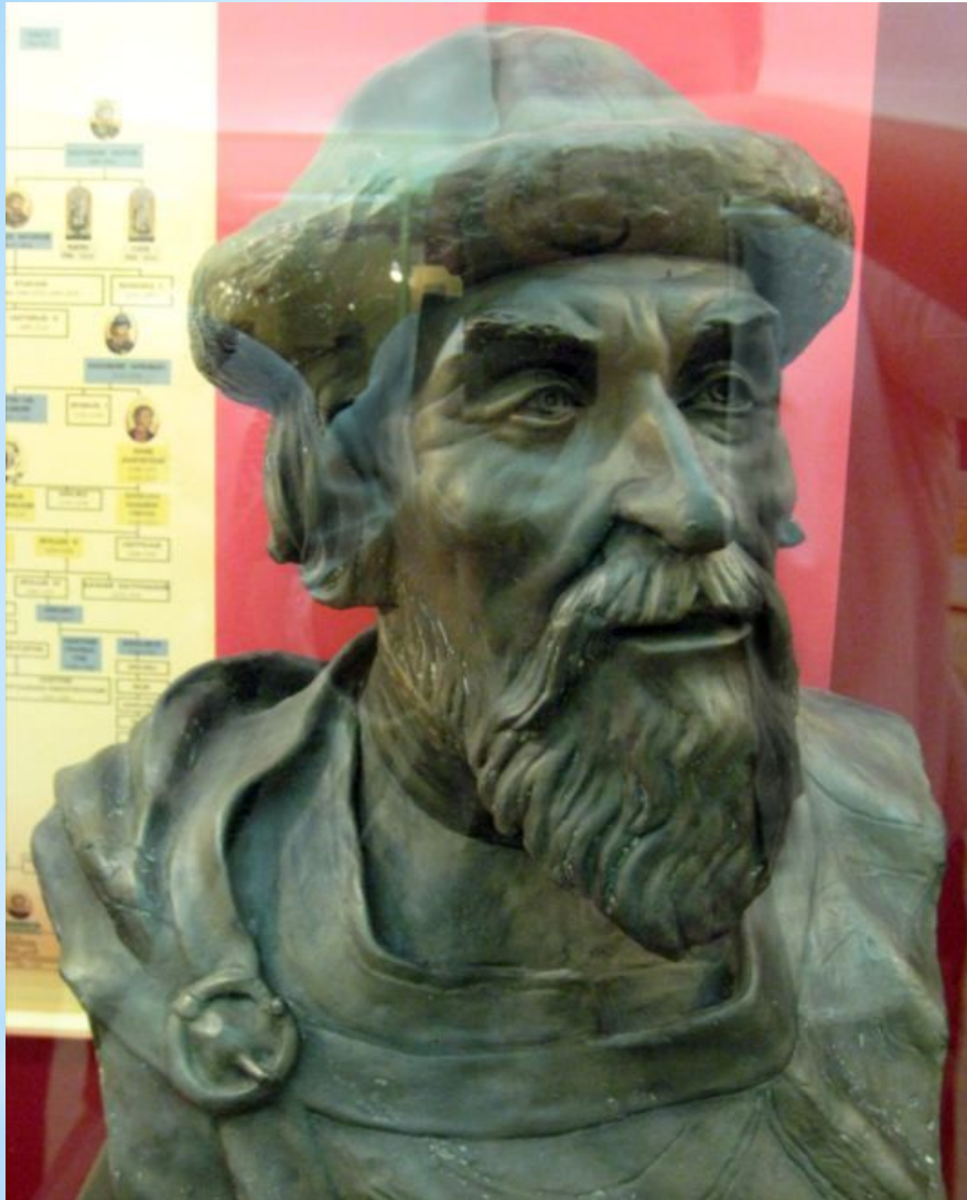
Князь Ярослав Мудрый

Ярослав Мудрый родился 987 г.. а умер в 1054г. Ярослав Владимирович — сын крестителя Руси князя Владимира Святославича из рода Рюриковичей и полоцкой княжны Рогнеды Рогволодовны. Он отец, дед и дядя многих правителей Европы. При крещении был наречён Георгием. Вошла в историю составленная при Ярославе «Русская правда», ставшая первым известным сводом законов на Руси.