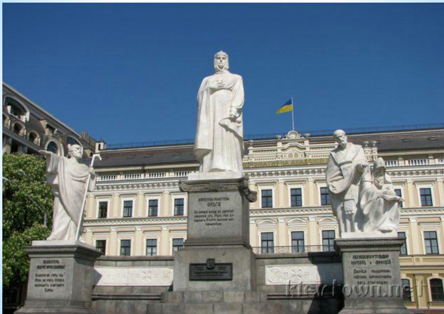
Пам'ятник княгині Ользі в Києві