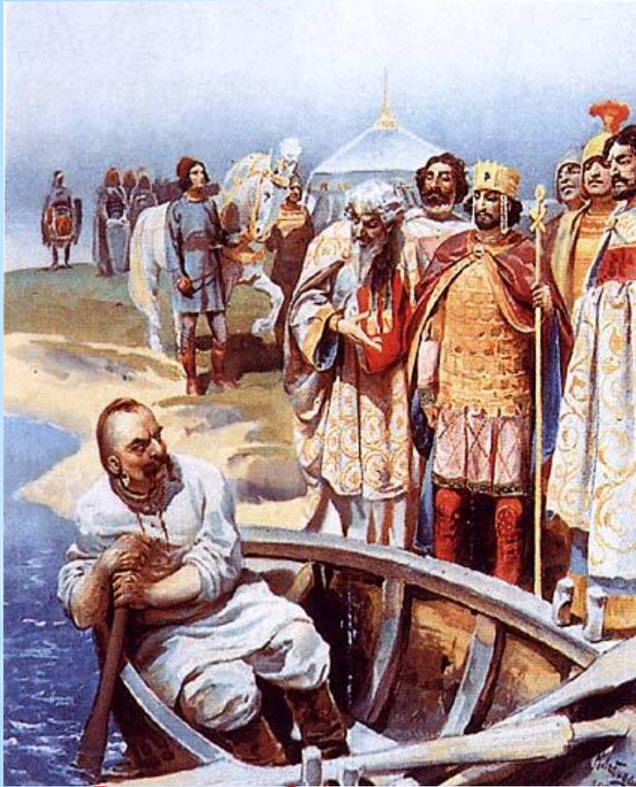
Встреча Святослава с императором Цимисхием после заключения мира

По заключении мира Святослав благополучно достиг устья Днепра. Однако печенеги по-прежнему сторожили руссов. В схватке Святослав погиб: «Когда наступила весна, отправился Святослав к порогам. И напал на него Куря, князь печенежский, и убили Святослава, и взяли голову его, и сделали чашу из черепа, оковав её, и пили из неё. Свенельд же пришел в Киев к Ярополку».