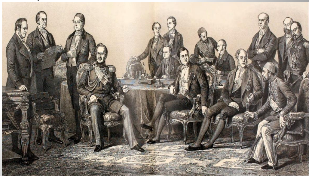
Cavour Cowley Buol Orlov Bourquenay Hilmar Walewski Djemil Benedetti Clarendon Brunner Aali Haridich Villamarina