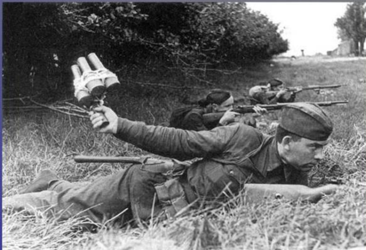
Пехотинцы одного из подразделений 177 Стрелковой дивизии РККА готовятся к встрече с немецкими танками. Район Луги. Июль 1941г.

10 июля 1941 года – на 19-й день войны началась героическая оборона Ленинграда. (Начало боев на Лужском рубеже.)