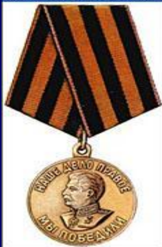
МЕДАЛЬ «ЗА ПОБЕДУ НАД ГЕРМАНИЕЙ В ВЕЛИКОЙ ОТЕЧЕСТВЕННОЙ ВОЙНЕ 1941-1945»

Медаль "За победу над Германией в Великой Отечественной войне 1941 - 1945 гг." Учреждена Указом Президиума Верховного Совета СССР от 9 мая 1945 г. для награждения как военнослужащих, так и гражданских лиц, принимавших непосредственное участие на фронтах Отечественной войны или обеспечивших победу своей успешной работой. Всего к началу 1977 г. награждено более 14 900 тысяч человек.