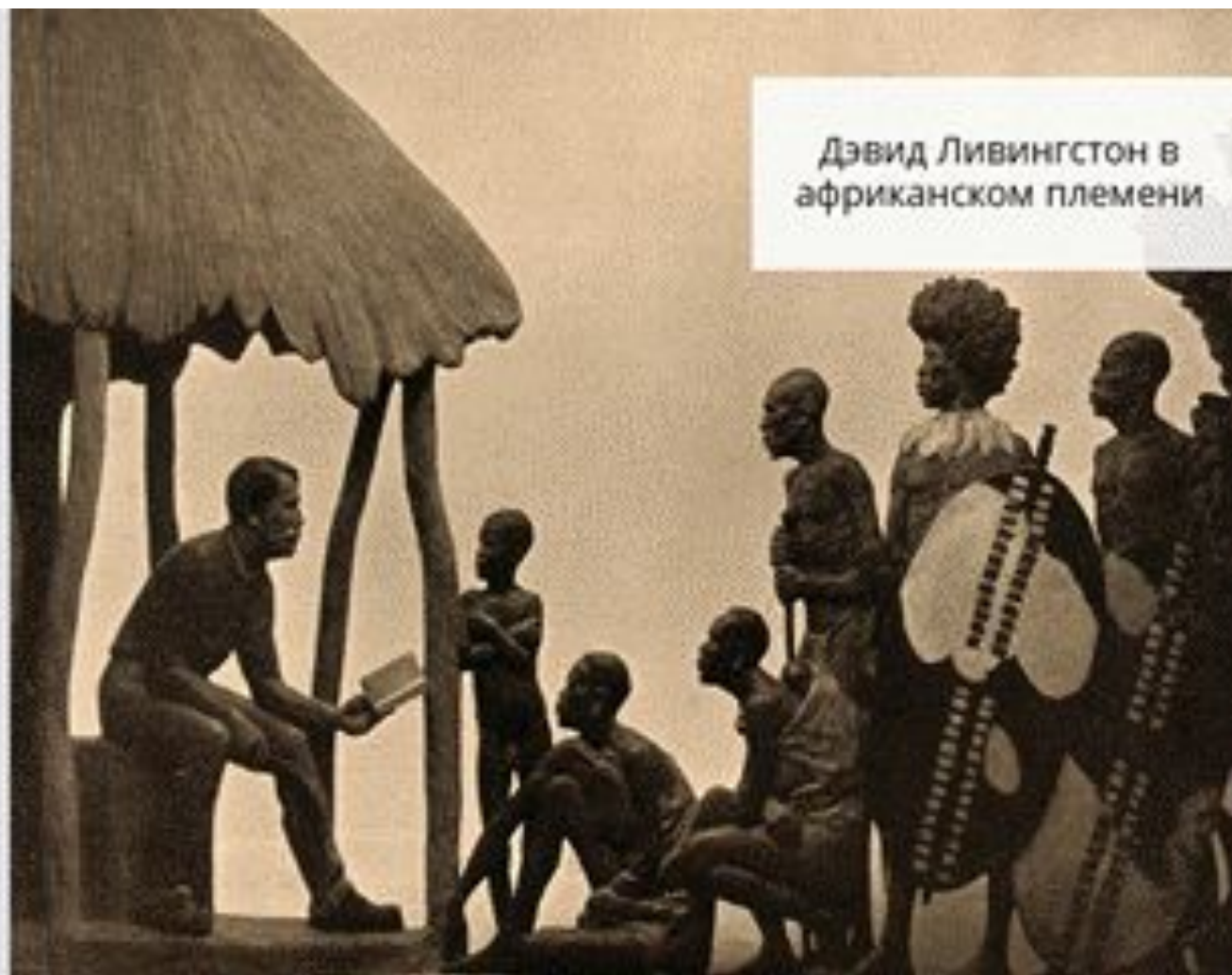
Дэвид Ливингстон в африканском племени