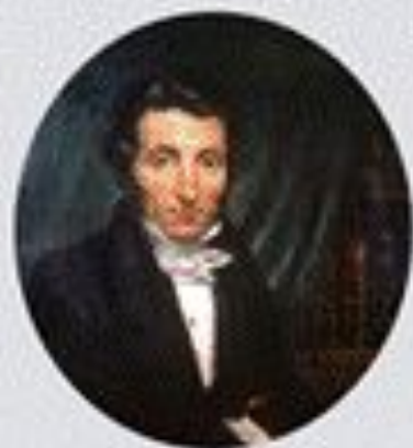
Рене Огюст Кайе (1799–1838)