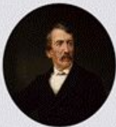
Дэвид Ливингстон (1813–1873)