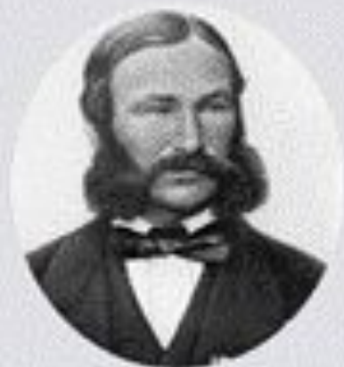
Генрих Барт (1821–1865)