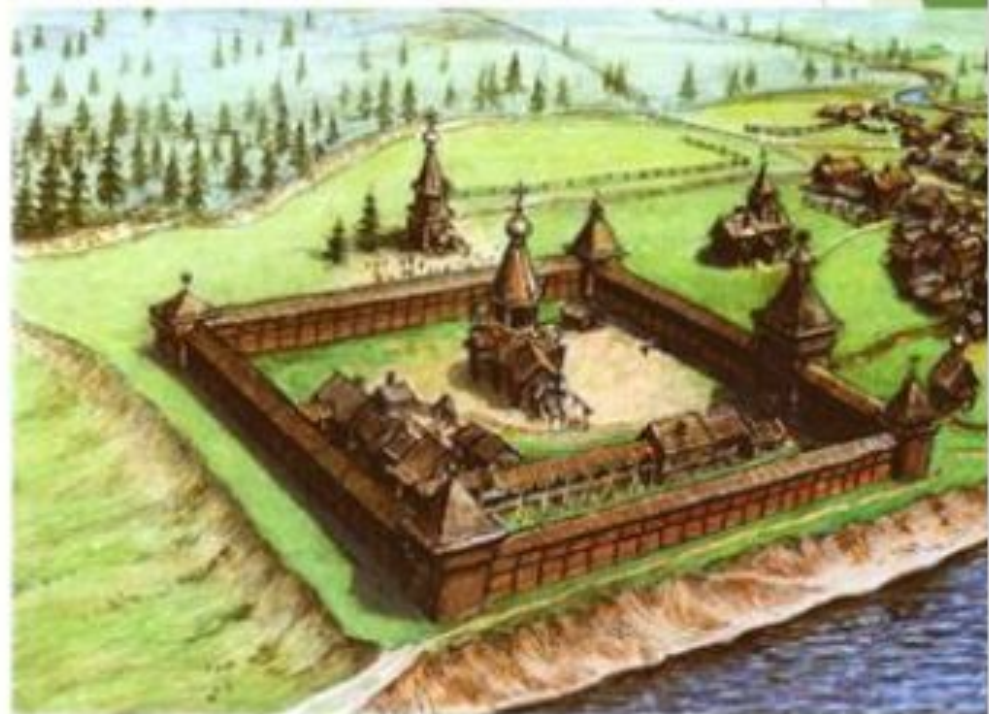
Сибирский город Мангазея. XVII век. Рисунок В. Никишина

Первые русские города в Сибири: Тюмень (основанная на месте татарского поселения в 1586 г.), Тобольск (1587 г.), Мангазея (основана как острог в 1601 году, статус города — с 1607 года), Братск (1631 г.), Якутск (1632 г.), Иркутск (1661 г.).