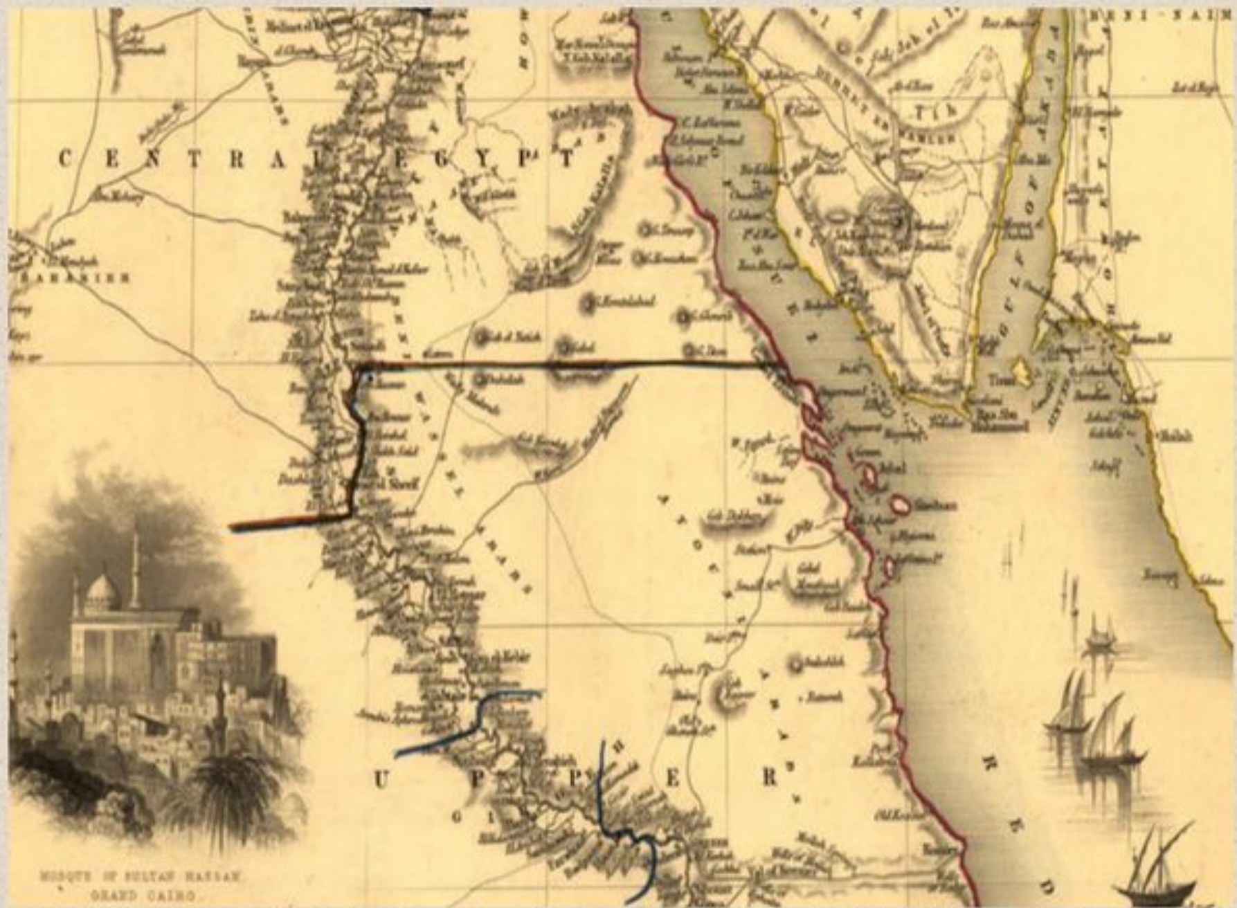
MOSQUE OF SULTAN HASSAN, GRAND CAIRO.