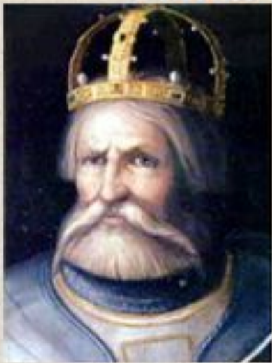
Немецкий император: Фридрих I Барбаросса

Во главе третьего крестового похода стояли: