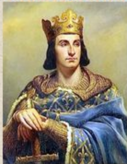
Французский король Филипп II Август