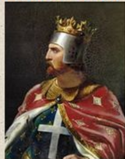
Английский король Ричард I Львиное Сердце