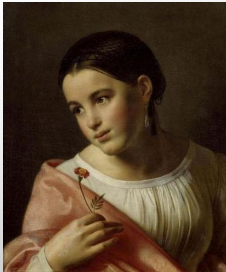
ДЕВУШКА С ГВОЗДИКОЙ