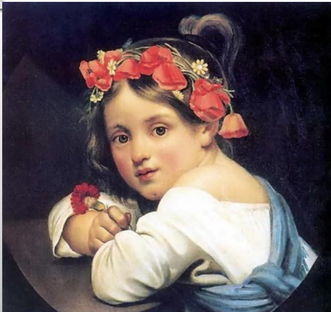
ДЕВОЧКА В МАКОВОМ ВЕНКЕ И ГВОЗДИКОЙ В РУКЕ