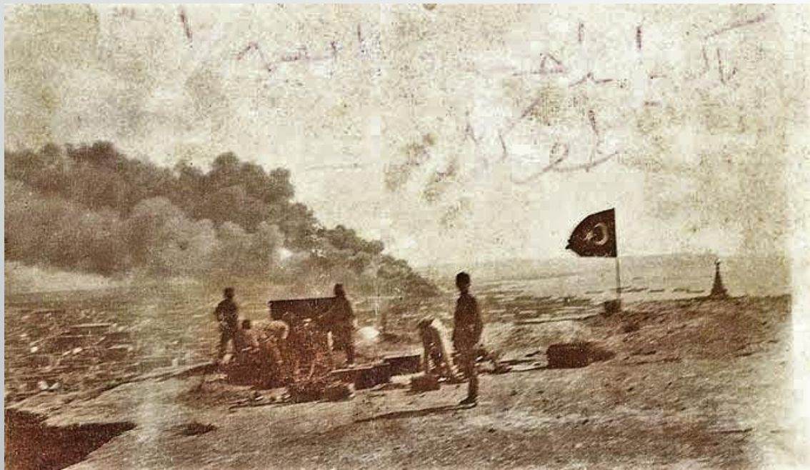
Турецкая батарея на высотах около Баку