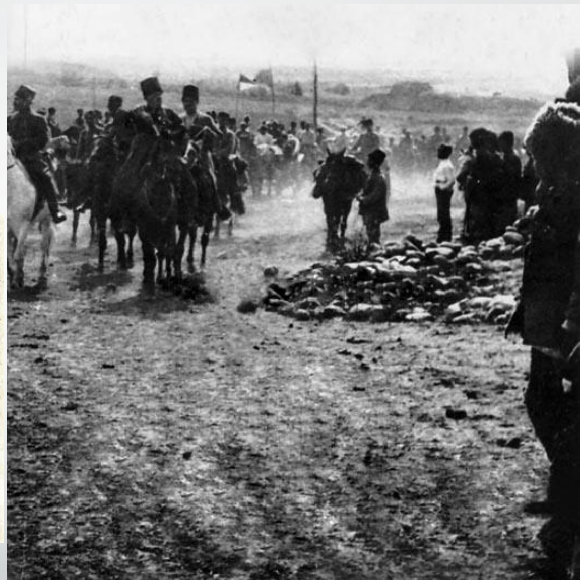
Турецкая кавалерия в районе Баку