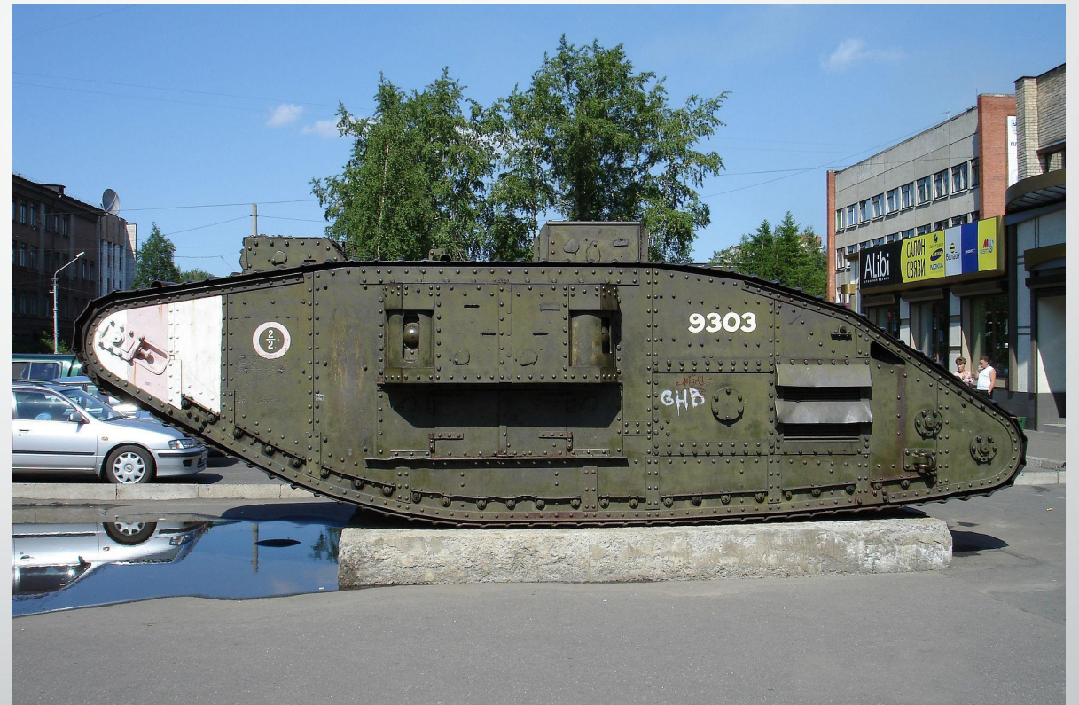
Архангельск: памятник жертвам интервенции и трофейный английский танк