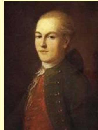
Г. А. Спиридов (1713-1790)