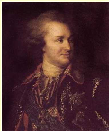
Г. А. Потёмкин (1739-1791)