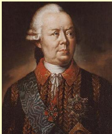
П. А. Румянцев (1725-1796)