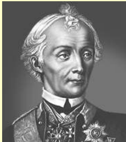
А. В. Суворов (1730-1800)