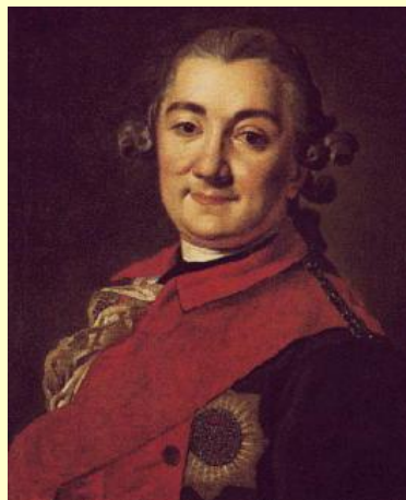
А.Г. Орлов (1737-1807)