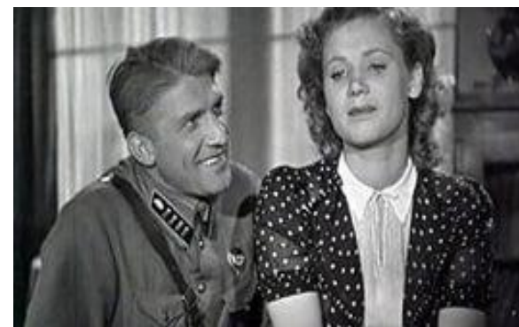
Парень из нашего города