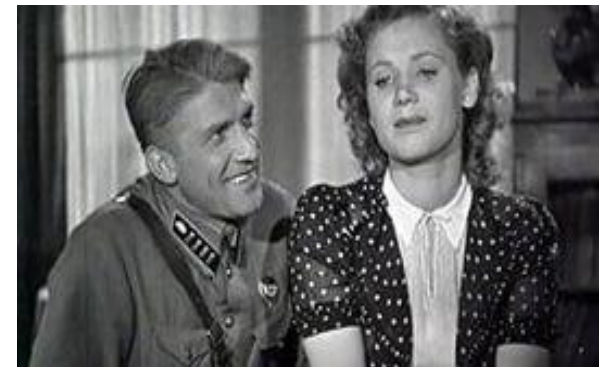
Парень из нашего города