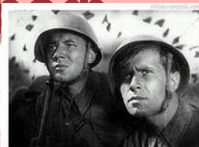
Фильм « Два