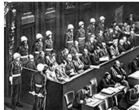
Фильм «Суд народов» о Нюрнбергском процессе