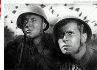
Фильм « Два