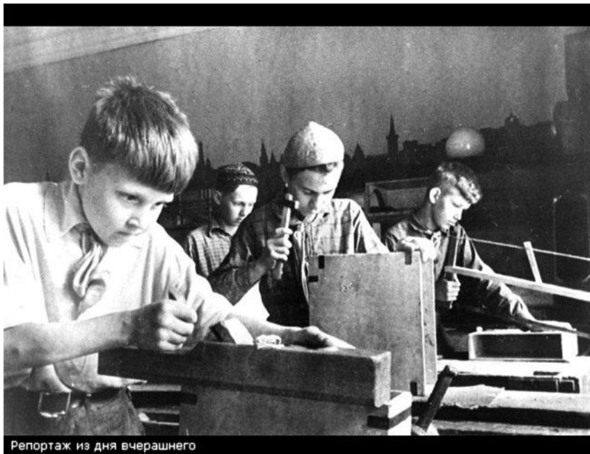
Репортаж из дня вчерашнего

Огромное значение в школе военного времени отводилось трудовому обучению школьников. В первые же дни войны местные партийные, комсомольские и советские органы, отделы народного образования, руководители школ организуют школьников на оказание помощи сельскому хозяйству, промышленности и транспорту, чтобы заменить взрослых, мобилизованных в Красную Армию.