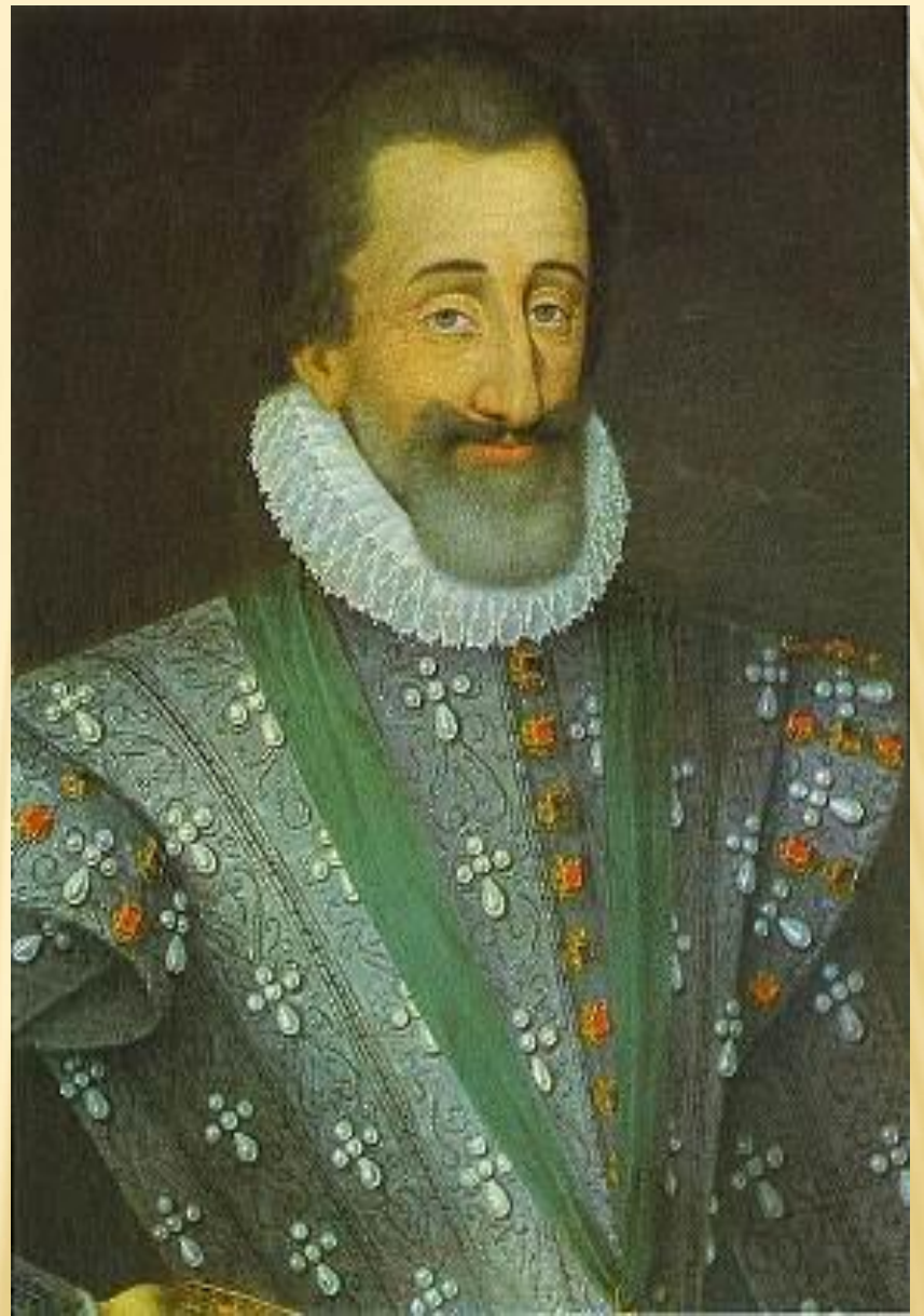
Генрих IV Бурбон