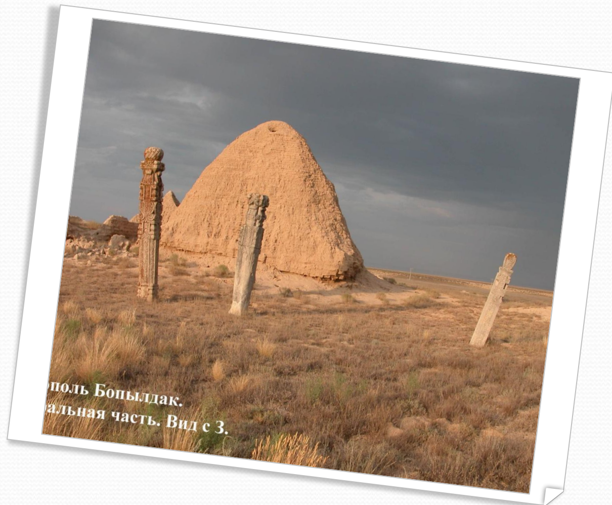
Курган Бопылдак. Центральная часть. Вид с 3.