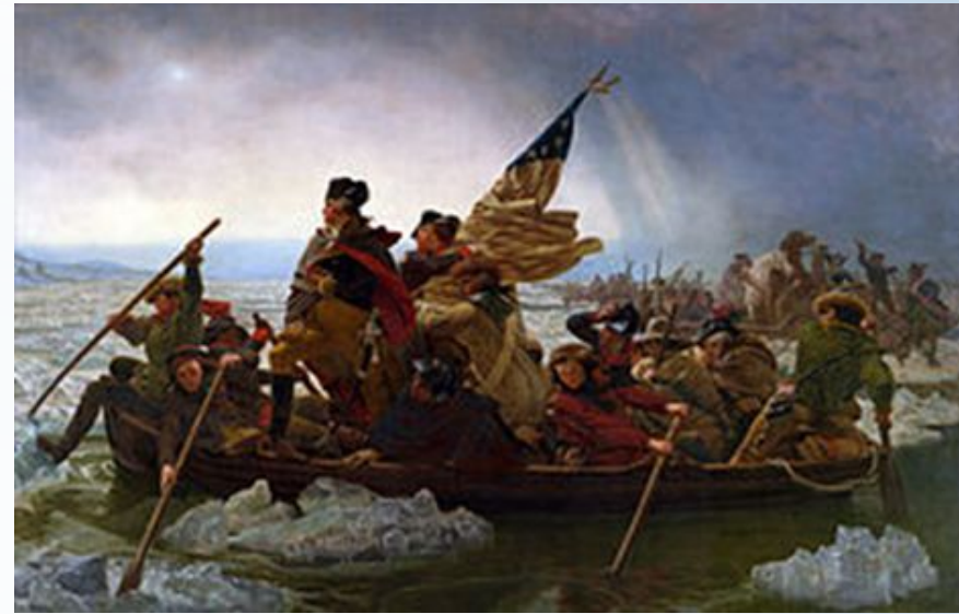
25 декабря 1776 г. Вашингтон форсирует реку Делавер