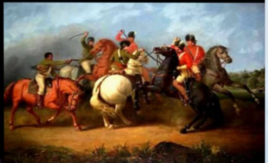
Сверху вниз по часовой стрелке: битва при Банкер-Хилле, смерть Монтгомери при Квебеке, битва при Коупенсе, битва при лунном свете