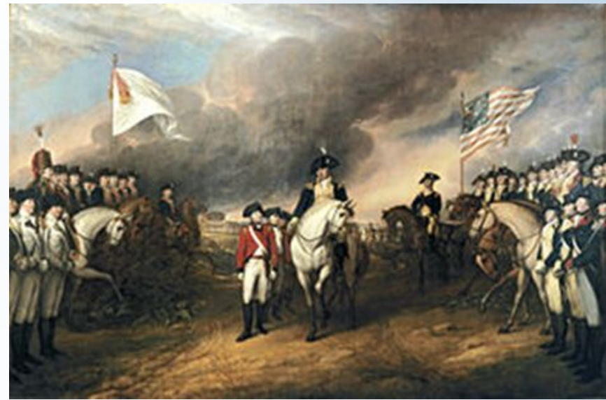
Капитуляция англичан при Йорктауне

* В результате 13 английских колоний в Америке объединились в независимую республику, получившую название Соединенные Штаты Америки.