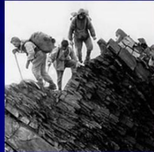
Слева гора Рагдан, справа-Базардюзю

Крайняя южная точка России ( 41^{\circ}11' с. ш.) находится к юго-западу от горы Базардюзю, на границе Дагестана с Азербайджаном. Крайняя западная точка лежит в Калининградской области под 19^{\circ}38' в. д., на Балтийской косе Гданьского залива Балтийского моря; но Калининградская область является анклавом, а основная территория России начинается восточнее, под 27^{\circ}17' в. д., на границе России с Эстонией, на берегу реки Педедзе. Таким образом, протяжённость территории России с севера на юг превышает 4 000 км, с запада на восток — приближается к 10 000 км.