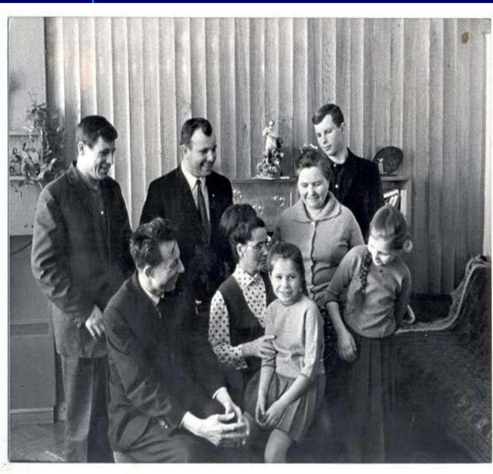
24 марта 1968 года. С семьей.