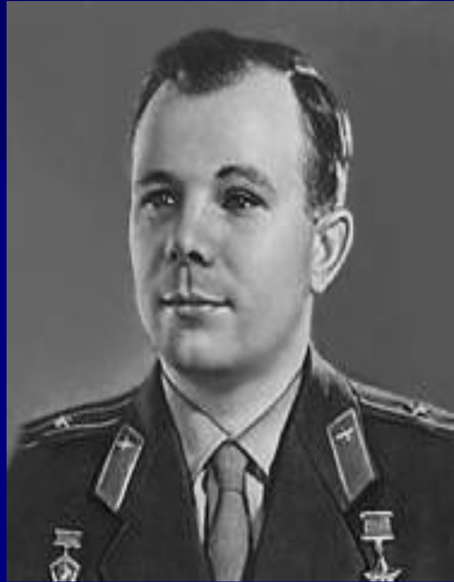
12 апреля 1961 год. Космический корабль-спутник «Восток»