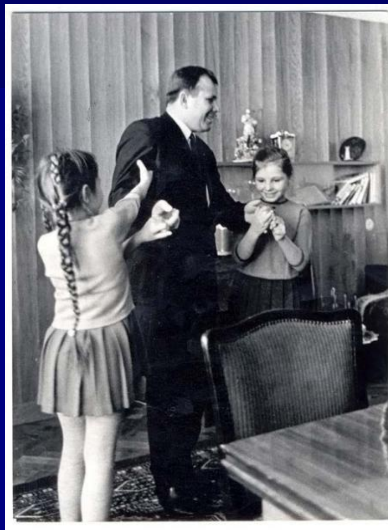
24 марта 1968 года. С детьми.