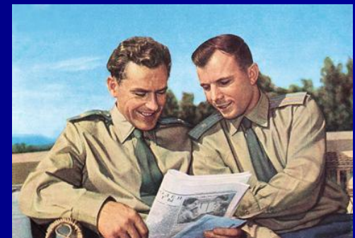
Гагарин и Титов