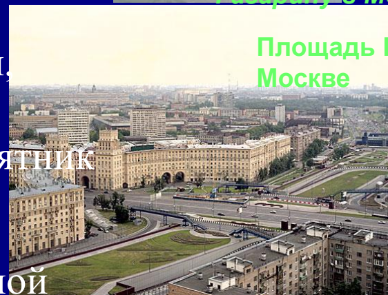
Площадь Гагарина в Москве