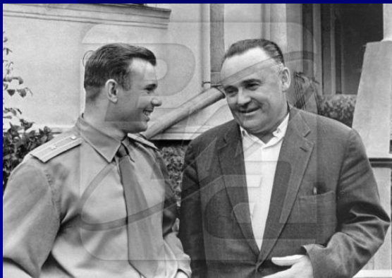
Гагарин и Королев

Марк Галлай — человек, который готовил космонавтов к полёту — однажды сказал очень точно: «В любом авиационном полку можно набрать двадцать таких лётчиков...». Из двадцати претендентов отобрали шестерых. Старт планировалось назначить полет между 11 и 17 апреля 1961 года. Того, кто полетит в космос, определили в последний момент, на заседании ГК, ими стали Гагарин и его дублёр Герман Титов