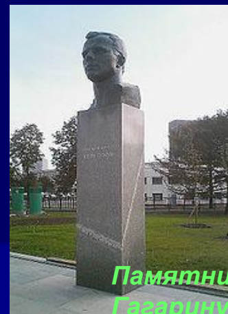
Памятник Юрию Гагарину в Москве