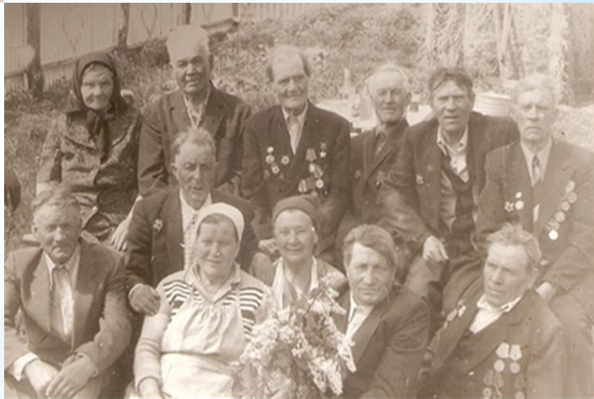
Встреча ветеранов ВОВ