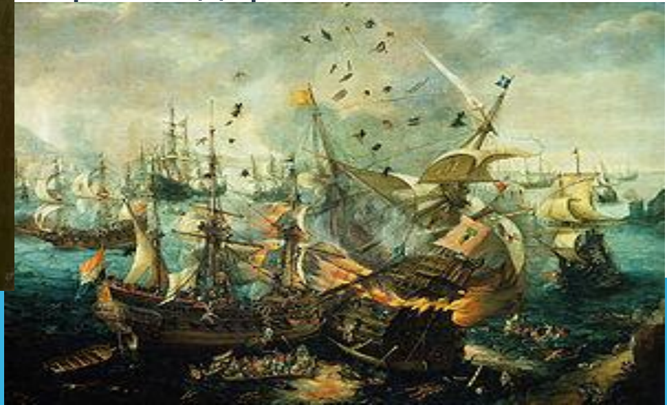
Гибель «Непобедимой Армады»

В 1588 году Филипп снарядил огромную эскадру. Её целью было завоевание Англии. Испанцы были разбиты, и Англия становится мировой морской державой