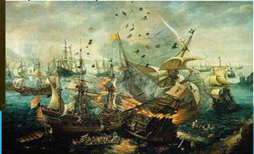
Гибель «Непобедимой Армады»

В 1588 году Филипп снарядил огромную эскадру. Её целью было завоевание Англии. Испанцы были разбиты, и Англия становится мировой морской державой