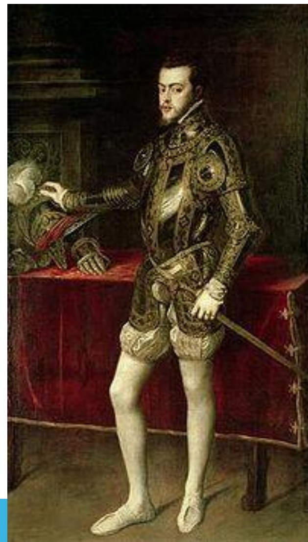
Муж Марии Кровавой Филипп II