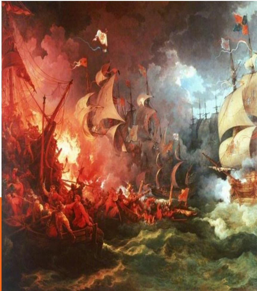
Поход «Непобедимой армады» 1588