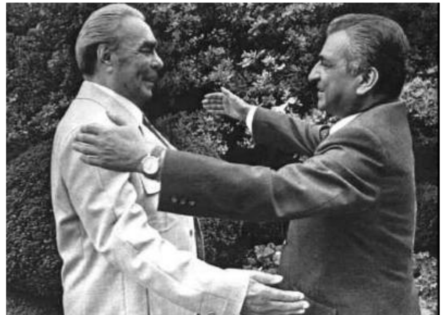
Л.Брежнев и Б.Кармаль.

СССР надеялся, что освободившиеся страны пойдут по пути коммунизма. Особые надежды возлагались на Афганистан. В 1978 г. здесь к власти пришли прокоммунистические силы, но между их лидерами разгорелась борьба за власть. 25 декабря 1979 г. после долгих споров среди советских руководителей в Афганистан были введены советские войска для поддержания стабильности в регионе. Война обошлась в 1млн. жертв для афганцев и 35 тыс.-для СССР.