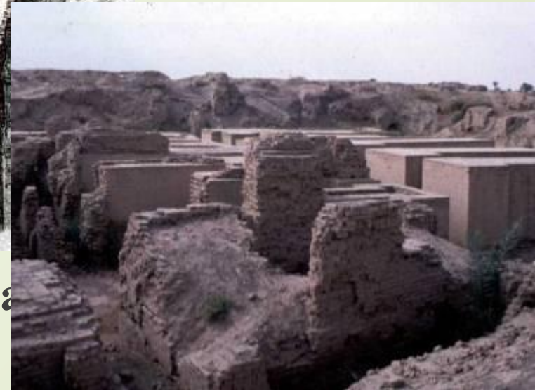
Крепостная стена Современный вид

Город был окружен стенами, длина которых была равна 12 км, высота же их превышала 10 м. Верх стен напоминал широкую улицу, по которой могли проехать несколько повозок.