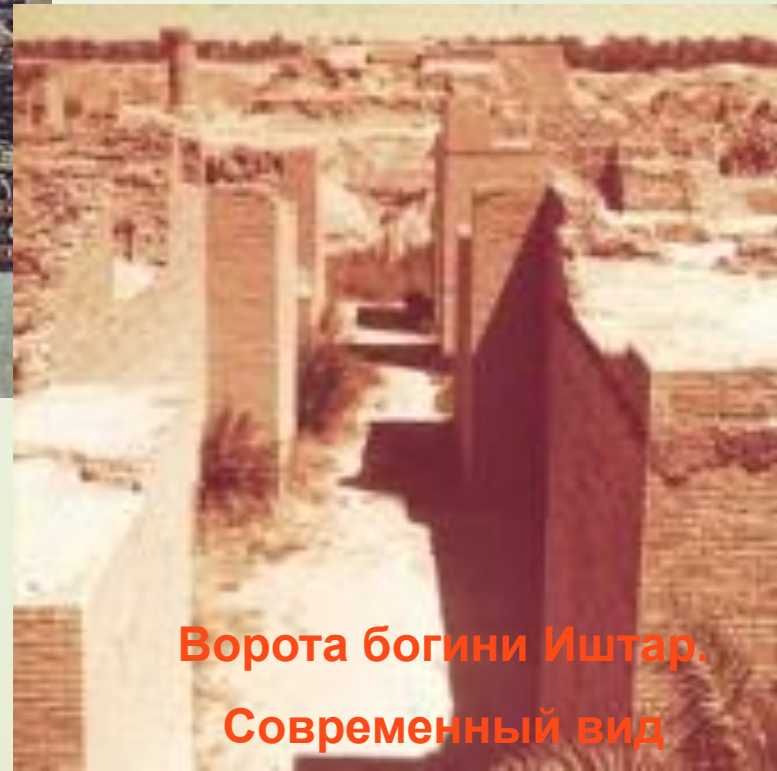
Ворота богини Иштар. Современный вид