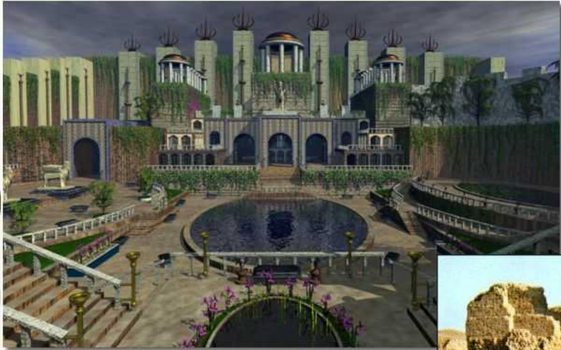
Дворец Хаммурапи Современный вид

Рекой Евфрат город был разделен на две части. В центре каждой было расположено высокое здание. В одной части был царский дворец.