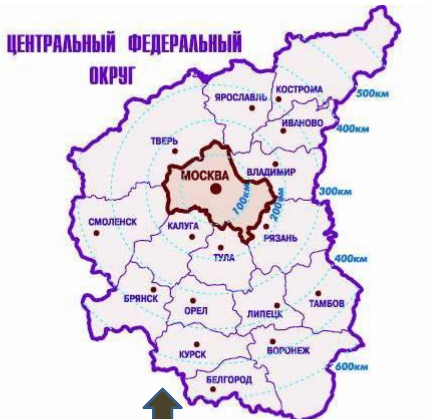
Центральный и Центрально-Черноземный районы