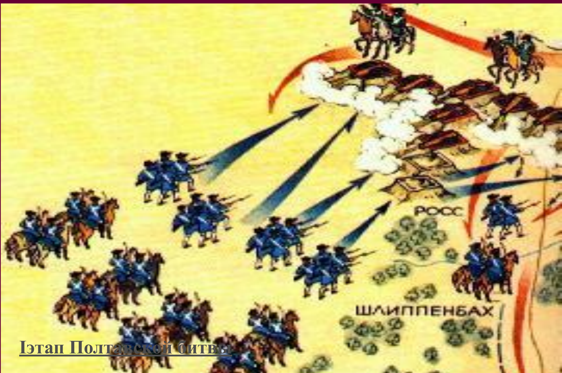
Этап Полтавской битвы