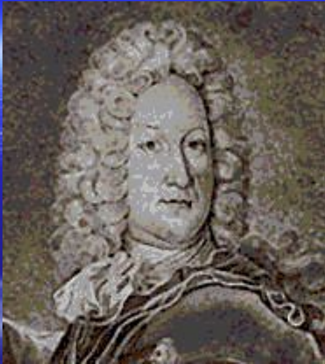
Борис Петрович Шереметев (1652-1719)