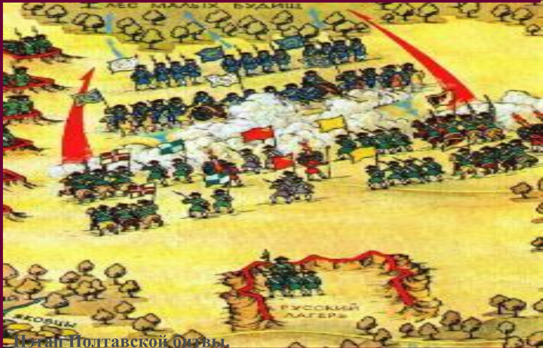
Этап Полтавской битвы.