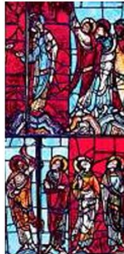
Витраж средневекового собора