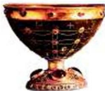
Средневековая драгоценная чаша