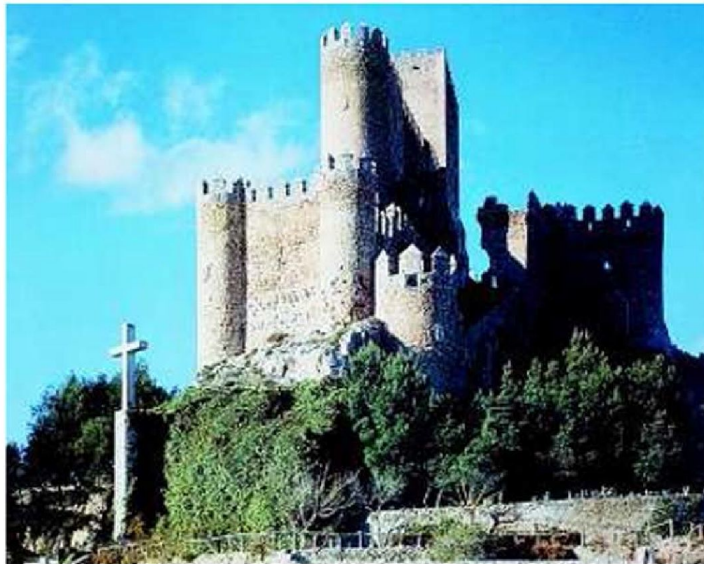
Средневековый замок в Испании