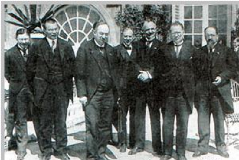
Генуэзская конференция. 10 апреля 1922 г.

10 апреля 1922 г. Международная конференция в Генуе (34 государства)