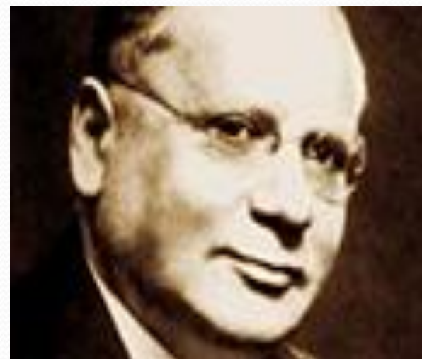
М.М. Литвинов 1930 – 1939 гг.