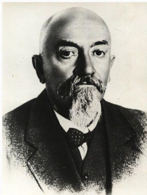
Г.В. Чичерин 1918 – 1930 гг.