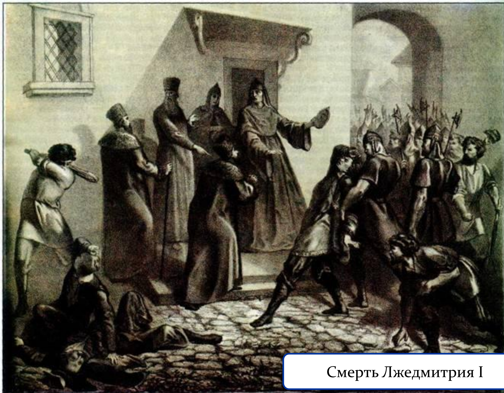
Смерть Лжедмитрия I