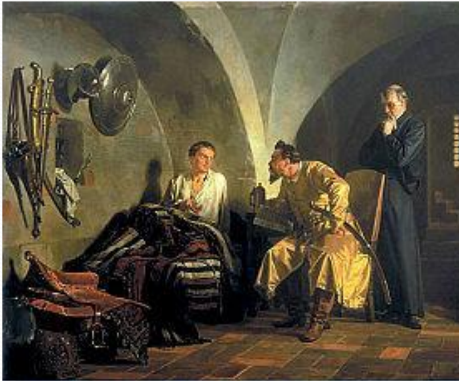
«Дмитрий Самозванец у Вишневецкого»