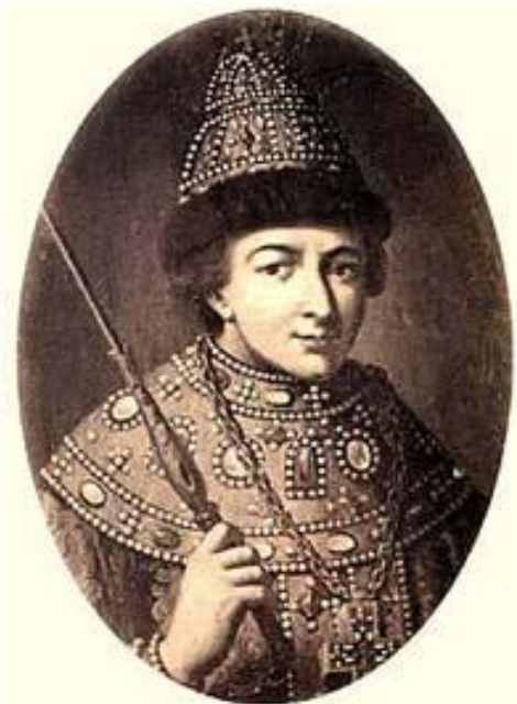
Царь Федор Борисович Годунов