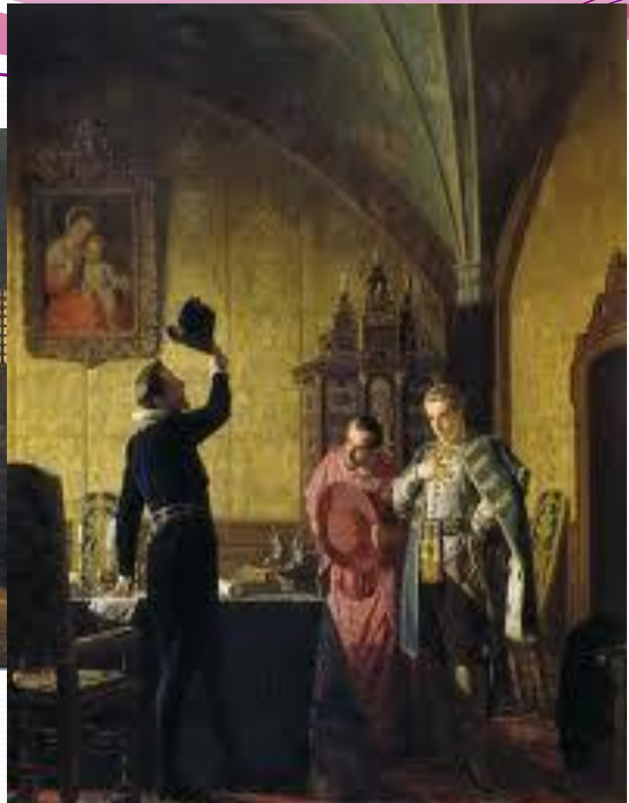
Присяга Лжедмитрия I польскому королю Сигизмунду III на введение в России католицизма.