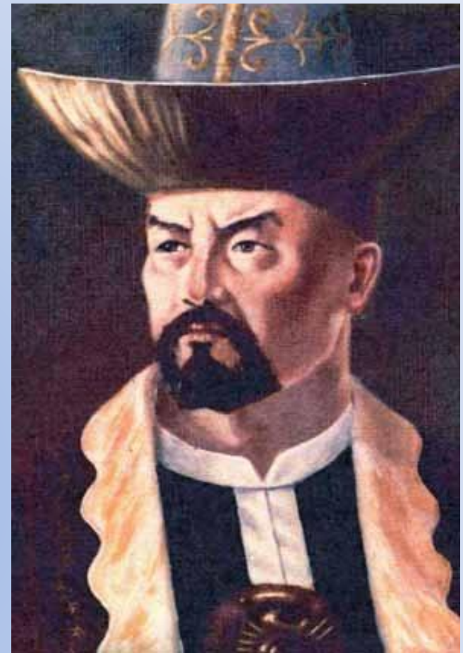
Сырым Датұлы (1742-1802)