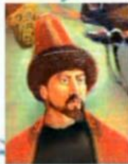
Сырым Датов 1783-1797 жж.

1785 жылы көктемінде көтерілісшілер күрес қимылдарын барынша кеңейтті. Көтерілісті мейлінше қолдаған байбақты, табын, тама руларына сүйенген Сырым Датұлы көтеріліс өрісін кеңейтуге тырысты.