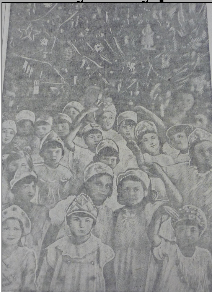
Ученики школы № 31 на елке в драмтеатре. Фото П. Петрова. // Магнитогорский рабочий. 1942 г. 18 января