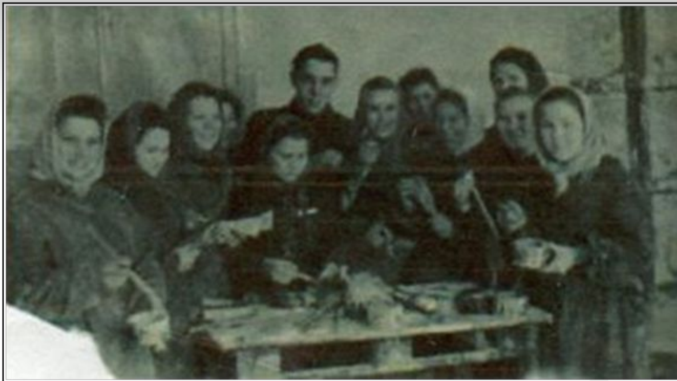
Студенты ФЗО № 28. 1940-е гг.