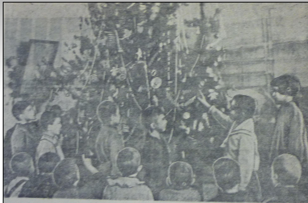
Дети у елки. Детский сад № 22. Фото П. Петрова // Магнитогорский рабочий. 1942. 7 января