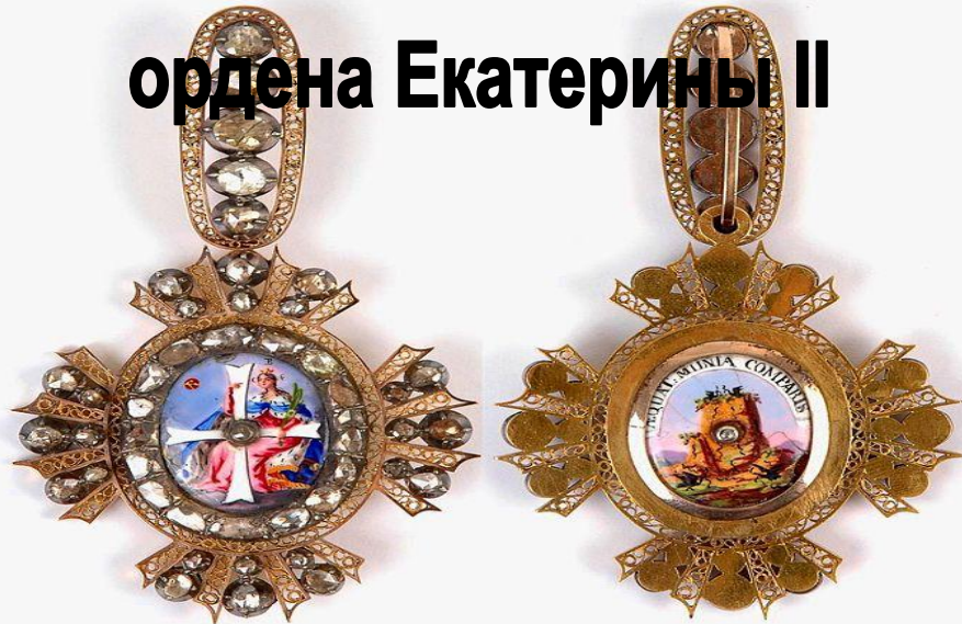
ордена Екатерины II