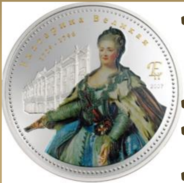
Монета при Екатерине