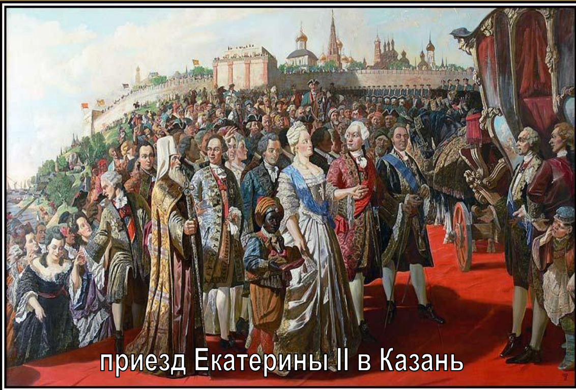
приезд Екатерины II в Казань

✓ В 1767 году Екатерина II объявила о созыве Комиссии для сочинения нового уложения, состоящей из выборных депутатов от всех социальных групп русского общества, за исключением крепостных крестьян. Екатерина написала для Комиссии «Наказ», являвшийся ее либеральной программой.