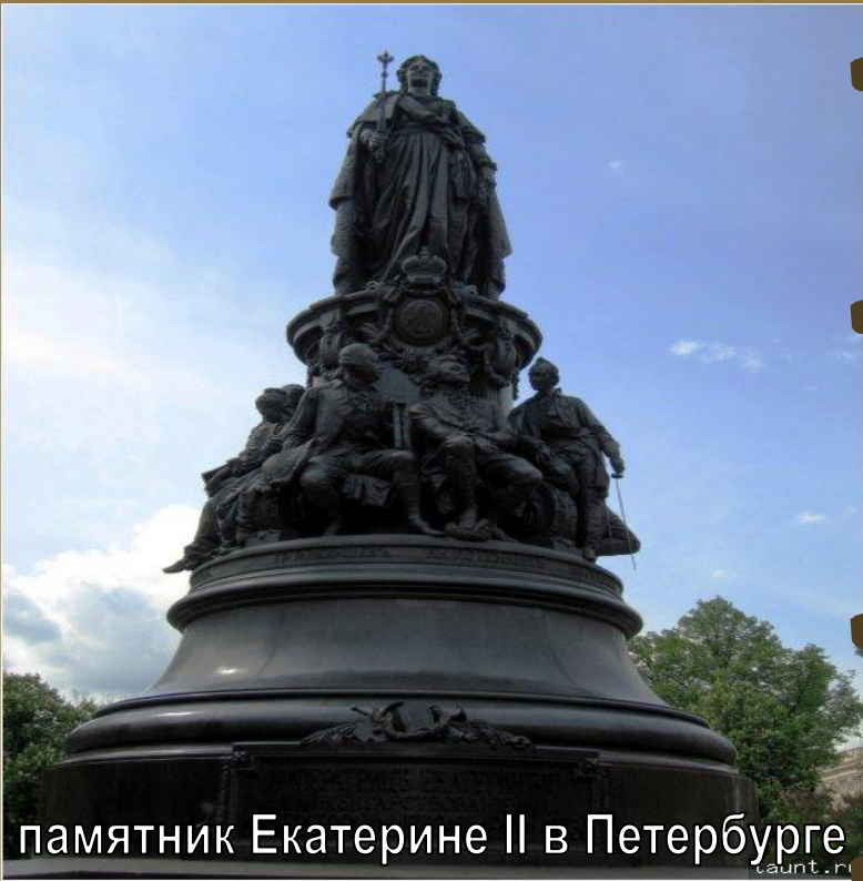
памятник Екатерине II в Петербурге