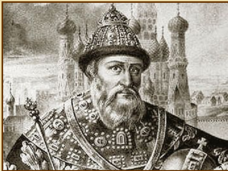
Иван III на Памятнике «1000-летие России» в Великом Новгороде