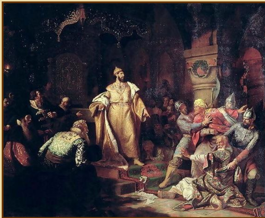
Картина Н. С. Шустова «Иоанн III свергает татарское иго, разорвав изображение хана и приказав умертвить послов» (1862)

1476 г. – прекращение выплаты дани («выхода»)