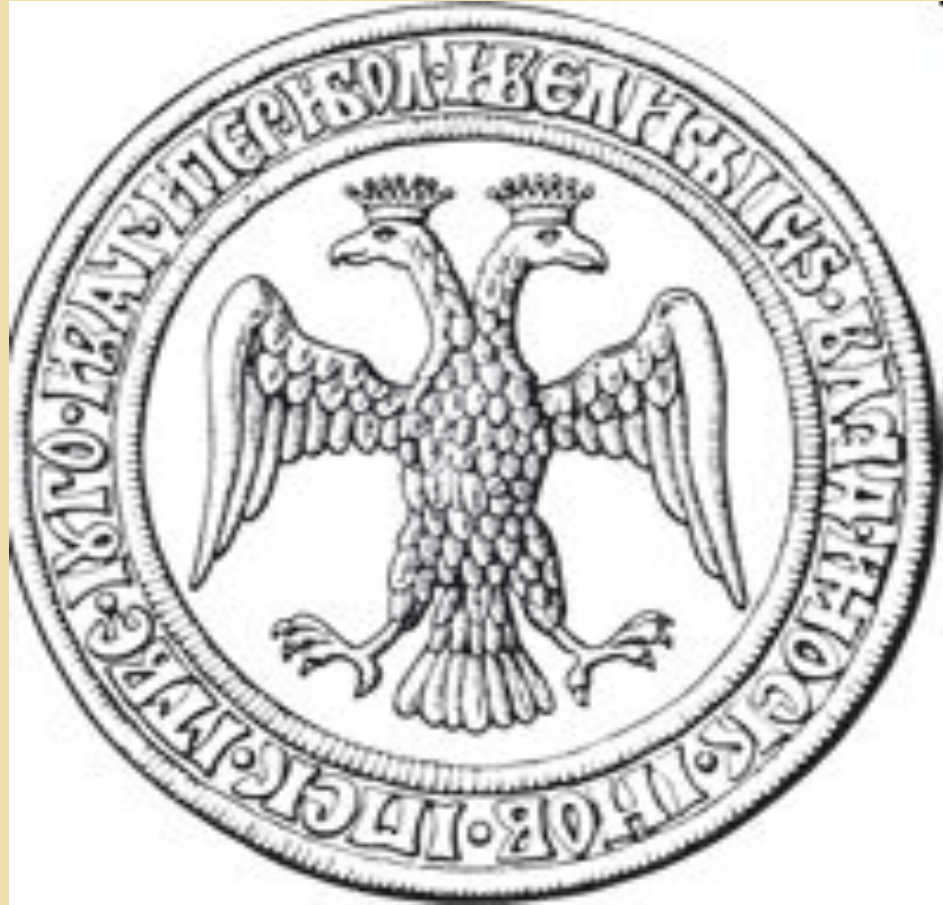
Прорисовка великокняжеской печати, датируемой 1497 годом