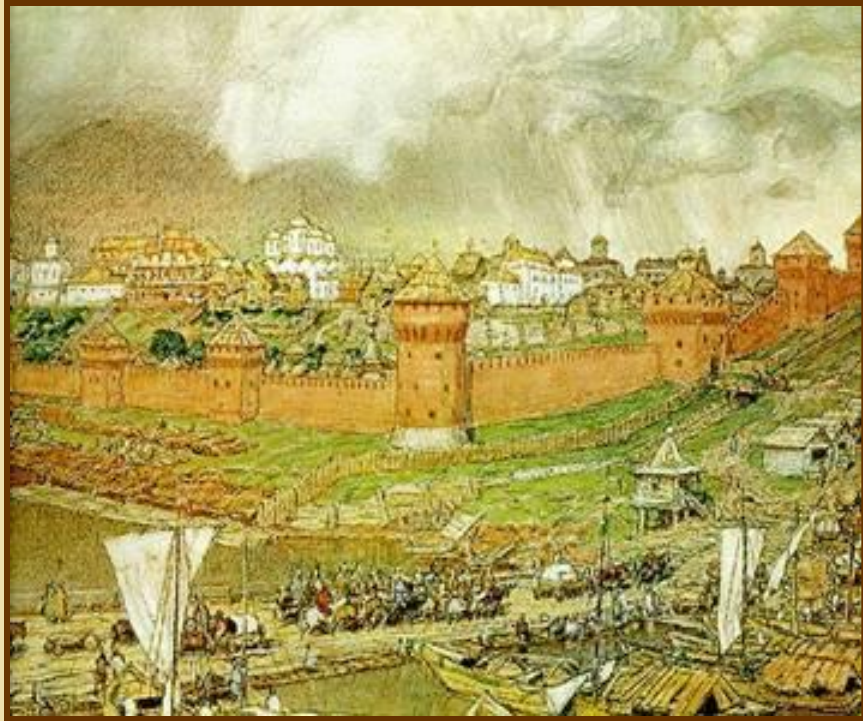
А. Васнецов «Московский кремль при Иване III»