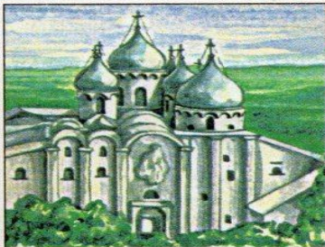
Софийский собор в Новгороде