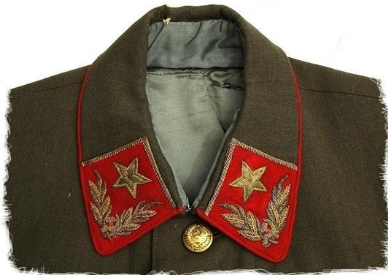
Петлицы Маршала Советского Союза