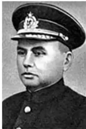
командующий вице-адмирал Ф.С. Октябрьский

Севастополь Керчь Крым Одесса Новороссийск Феодосия Кавказ