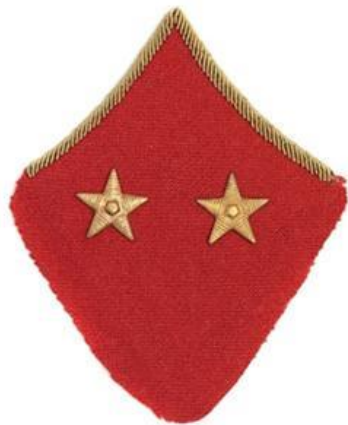
Повседневная петлица генерал-майора

4. Назовите геометрическую фигуру на петлицах высших офицеров Красной Армии в беспогонную эпоху.