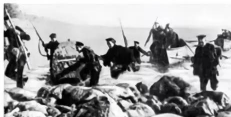
командующий вице-адмирал Ф.С. Октябрьский