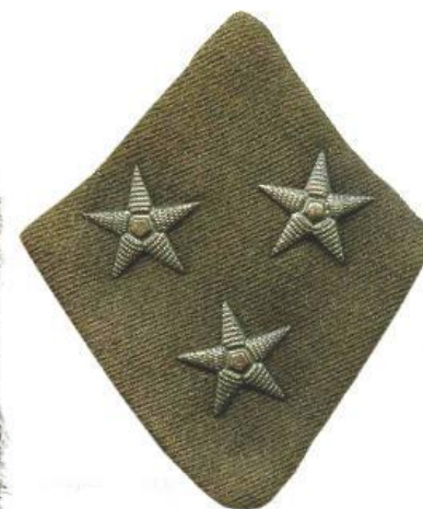
Полевая петлица генерал-лейтенанта