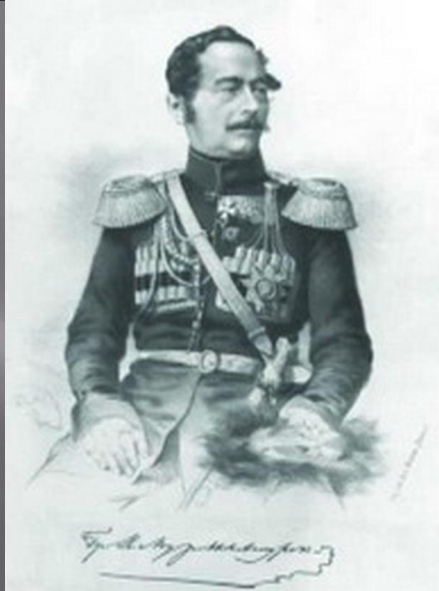
Н.Н. Муравьев- Амурский