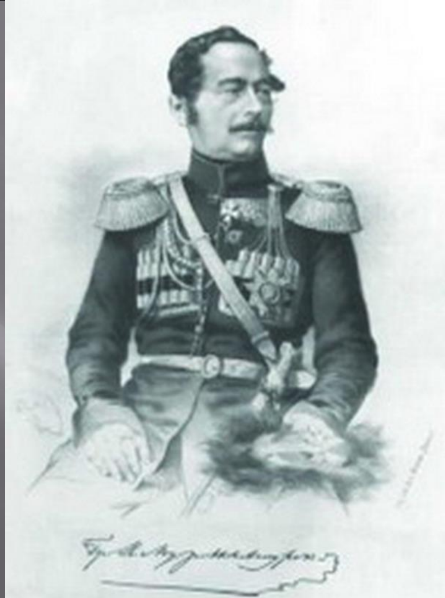
Н.Н. Муравьев- Амурский