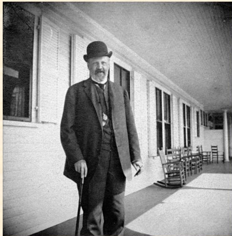
С. Ю. Витте на пароходе при путешествии в Америку