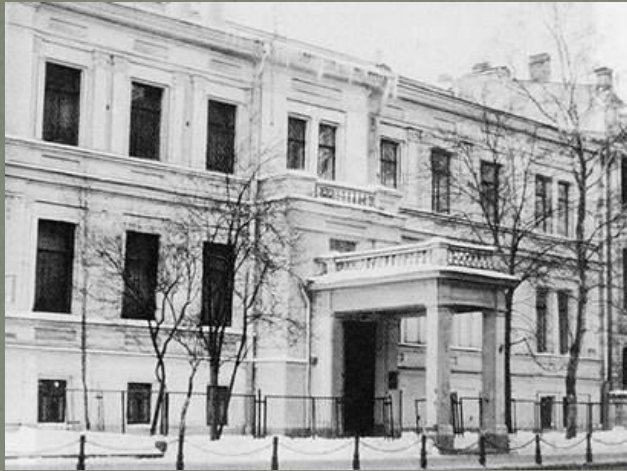
Дом семьи Витте

Витте был воспитан в духе монархизма. Мальчику дали домашнее образование. Он экстерном сдал экзамены и поступил в 1866 году на физико-математический факультет Новороссийского университета в Одессе.